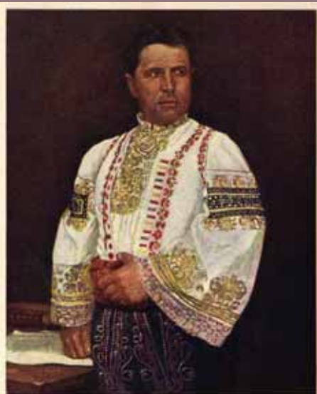
Uhorský Slovákosláv v slávorúchu.

My, po „Slove“ a „slope“ „Slováci“! My sme My! My sme Svoji! My sme Národ svojej reči! A My sa nedáme!