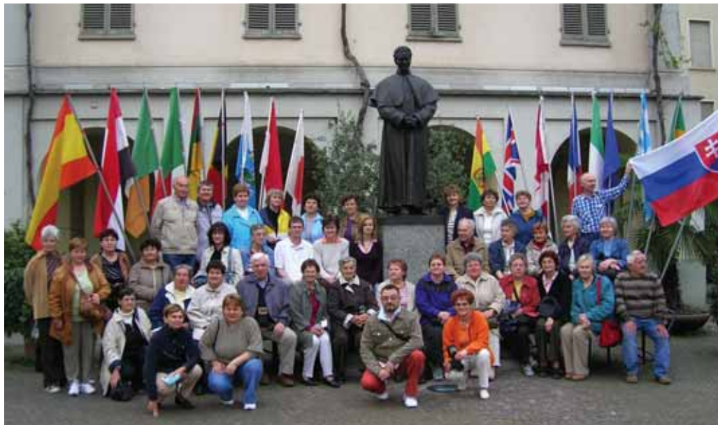
Pútnici v Turíne na Valdoku pred sochou svätého Jána Bosca.

Trinásteho apríla, hneď po raňajkách, sme odišli do Milána. Tam sme obdivovali milánsky Dóm a stred historického mesta. Popoludní pokračovala naša turínska púť do ústavu