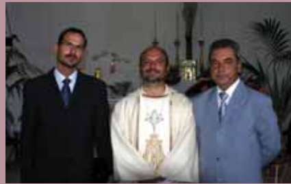
Starostovia s kňazom mestečka Alviano.