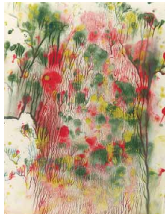
Filip Jura - monotypia.