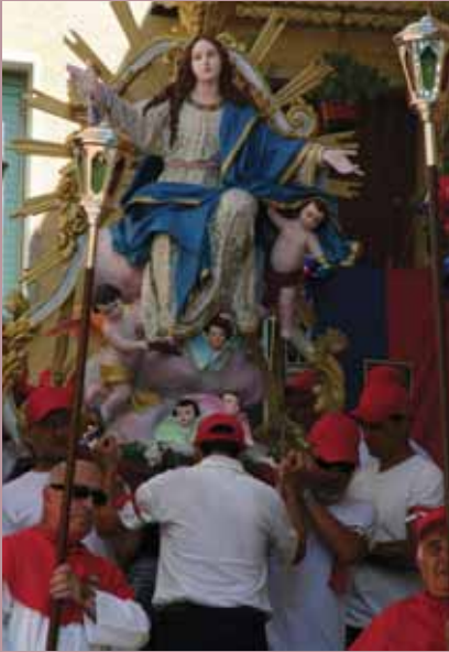
Socha sv. Panny Márie.