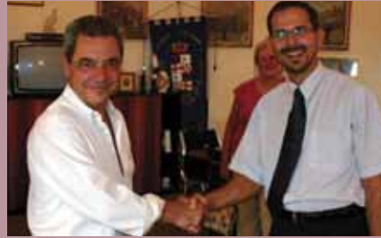
Stretnutie starostov Vajnora a Alviana.