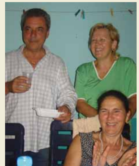
Taliani na „Kapustnicovom posedení“ u Feketovcov.