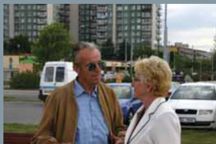
Prehliadka Mestskej časti Brna-Vinohradov...