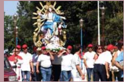
Procesia pri príležitosti sviatku Nanebovzatia Panny Márie.