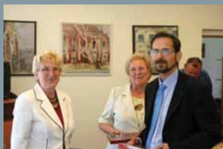
Starosta s prednostkou Vajnor pri rozhovore s predsedníčkou klubu starších.