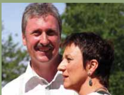
Starosta Wolfstahlu s poslankyňou.