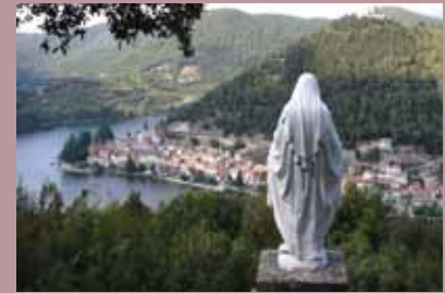
Na návšteve neďalekého turistického mestečka Piediluco.