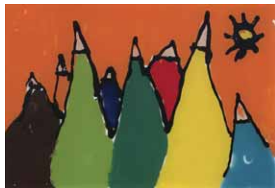
Dominik Schwab - maľba na skle.