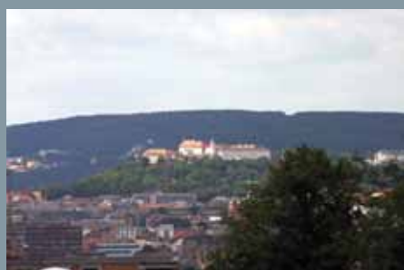
Pohľad na Špilberg z mestskej časti Brno-Vinohrady.