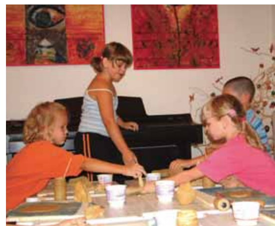
Modelovanie s hlinou.