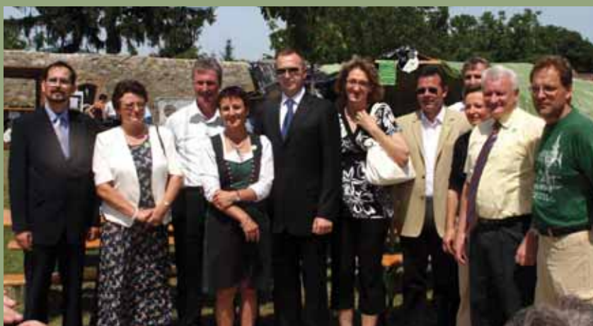
Zúčastnení starostovia a poslanci z okolia Wolfstahlu.