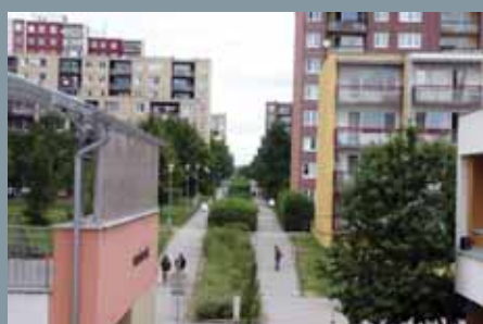
Pohľad na jednu z ulíc Vinohradov.

Už od pradávna sa ľudia navzájom navštevovali v cudzích krajoch či územiach. Najprv - možno ešte v jaskyniach aj so strachom a pudovo dozaista