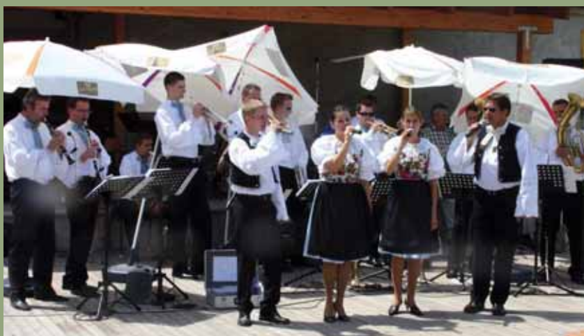
Dychová hudba Vištučanka.