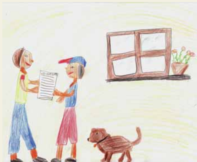
Ilustrácie: Veronika Porázková, 7 rokov