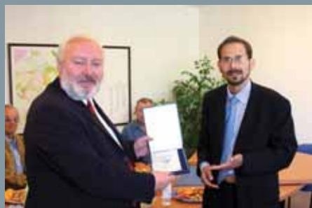
Starostovia si navzájom odovzdávajú spomienkové darčeky.