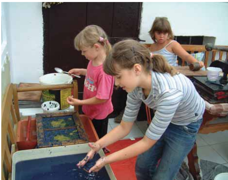
Výroba ručného papiera

remeslá, ktoré deti učili hrovou formou odborní lektori.