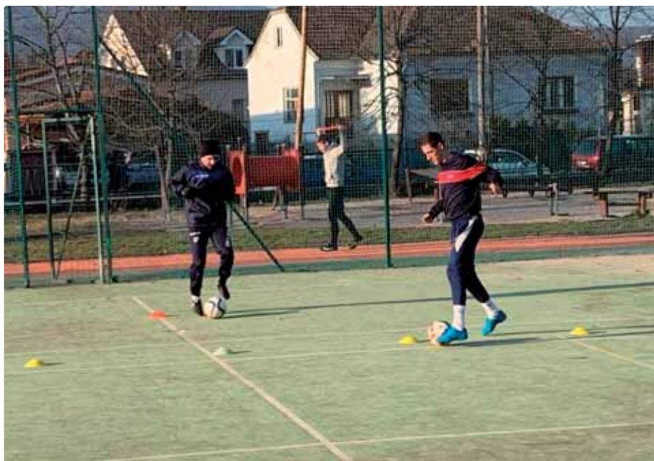
Tréning mužov FK Vajnory

Podrobné vyžrebovanie, presné dátumy a časy stretnutí i všetky ďalšie informácie nájdete na našej stránke www.fkvajnory.sk . Príďte povzbudiť naše tímy. Tešíme sa na vašu návštevu.