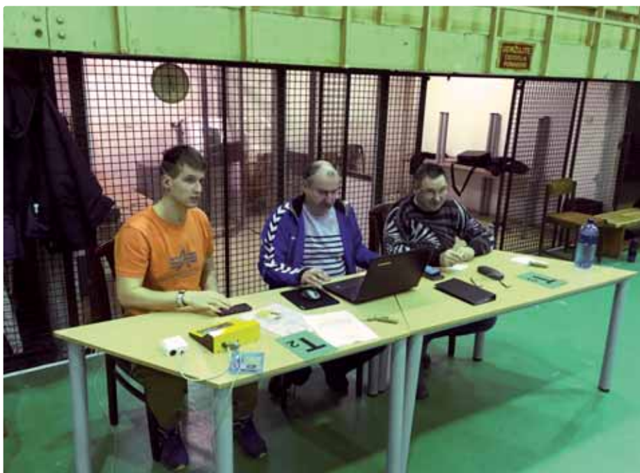
Rozhodcovia starostlivo strážia priebeh každého zápasu