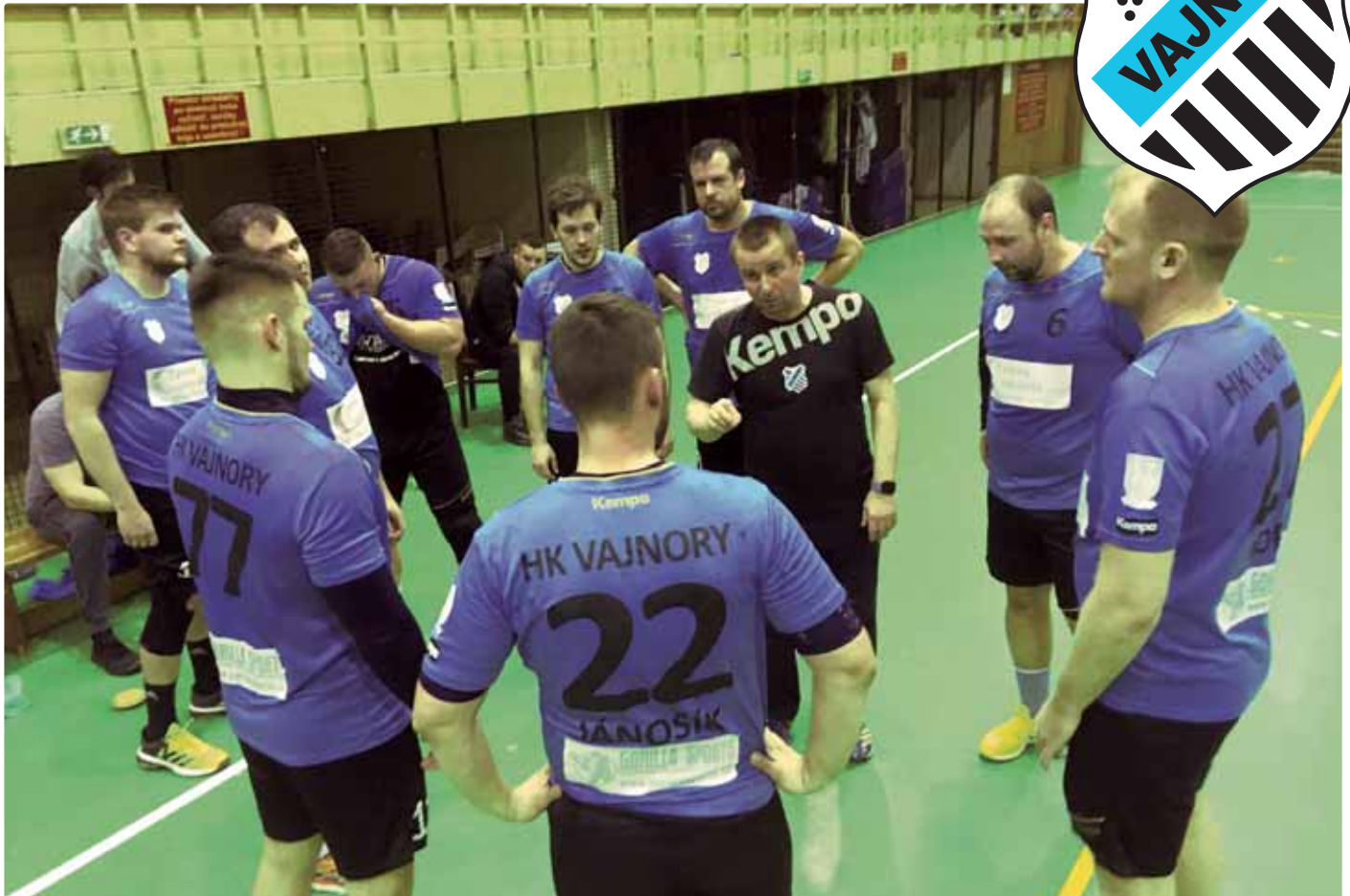
Prestávky využíva tréner na bojovú poradu s hráčmi

Text: Matej Jánošík