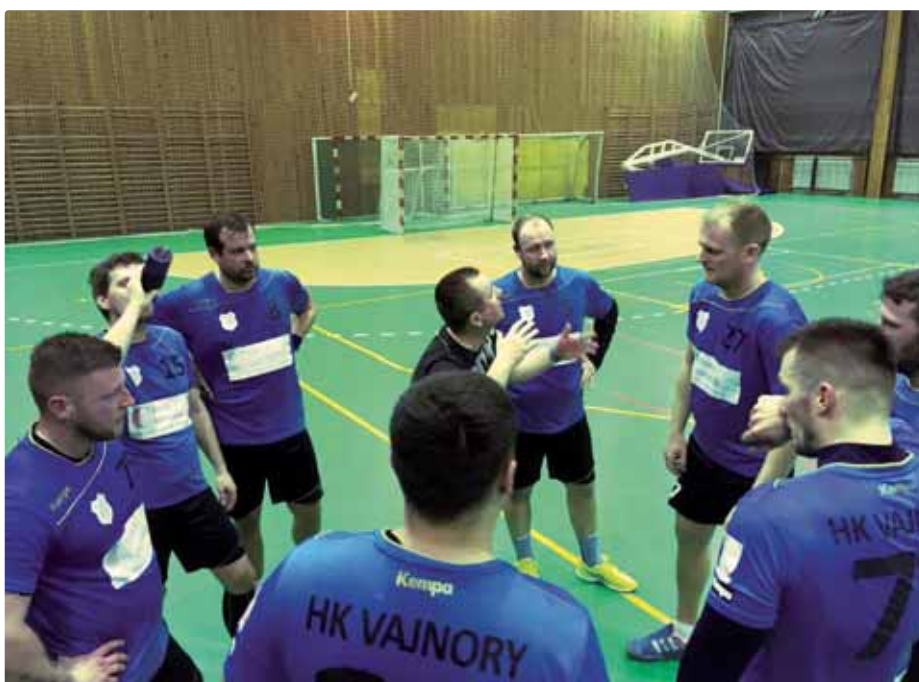
Prestávky využíva tréner na bojovú poradu s hráčmi

Pár slov k súťaži slušnosti, ktorá sa hodnotí na základe bodovania podľa počtu napomínaní, dvojminútových trestov a červených kariet (vylúčenia do konca zápasu). Túto súťaž sme pravidelne vyhrali. Teraz je priebežné poradie – Najslušnejší Martin, druhé Malacky a tretie Vajnory. Nuž, boj o body prináša aj tvrdšiu hru! Na chvoste hodnotenia je zatiaľ „najostrejší“ Pezinok a tesne pred ním Cífer. Tešíme sa na vašu podporu v najbližších zápasoch, ktoré aktuálne hrávame v Dome športu na Junáckej ulici.