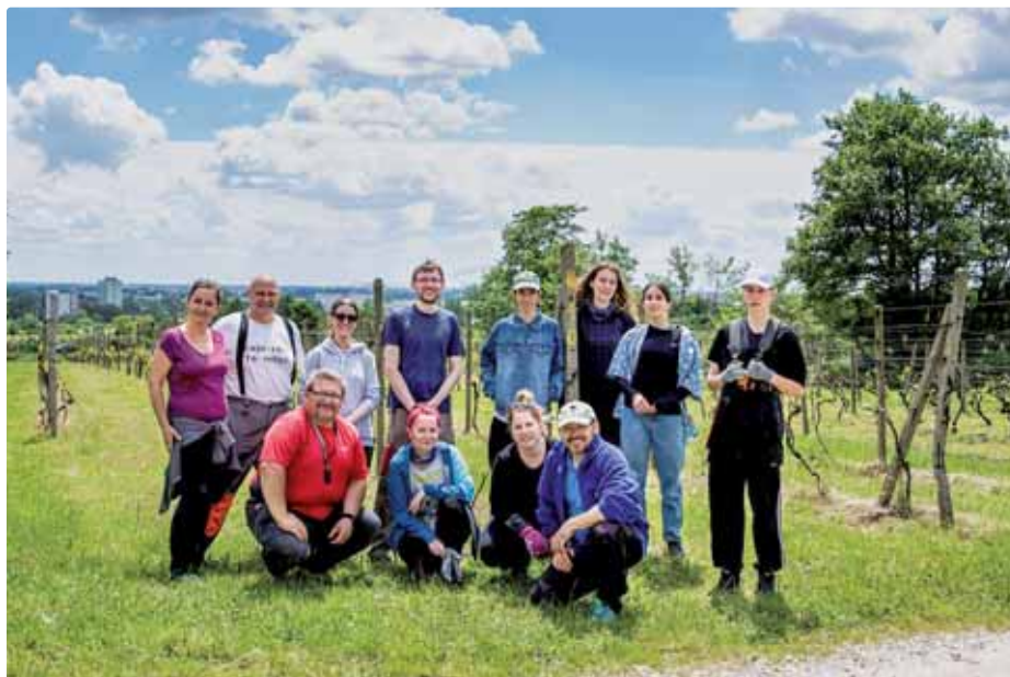
Dobrovoľníci vo vinohrade

Myšlienka zachrániť vajnorské vinohrady prišla celkom rýchlo. Ale ako zachrániť spustené vinohrady? V danom momente sa dalo iba jedno, vyhrnúť si rukávy, chytiť sa náradia a zapotiť sa pri tvrdej práci. Vinohrady však boli v takom stave, že do úvahy neprihádzala žiadna mechanizácia a všetko bolo treba robiť iba manuálne s ručnými nástrojmi. Opustených a zanedbaných vinohradov, ktoré potrebujú okamžitú pomoc, je tu okolo 100 ha a nám sa zatiaľ ručne podarilo zachrániť okolo 1,1 ha v rámci Komunitného vinohradu Široké, ktorý obrábame ako spolok aj s majiteľmi pozemkov. Napriek tomu, že sme spojili sily, bolo nás stále málo, a čas nezadržateľne bežal. Preto sme prostredníctvom sociálnych sietí oslovili priateľov a známych, či nám neprídu pomôcť ako dobrovoľníci. A veruže ešte sa našlo niekoľko ľudí, ktorí vymenili pohodlie domova za čas trávený prácou vo vinohrade. No táto výpomoc nebola pravidelná, preto sme sa rozhodli spojiť s Bratislavským dobrovoľníckym centrom a zorganizovať brigádu vo vinohrade v rámci ich akcie Zelené dni. Akcia nám