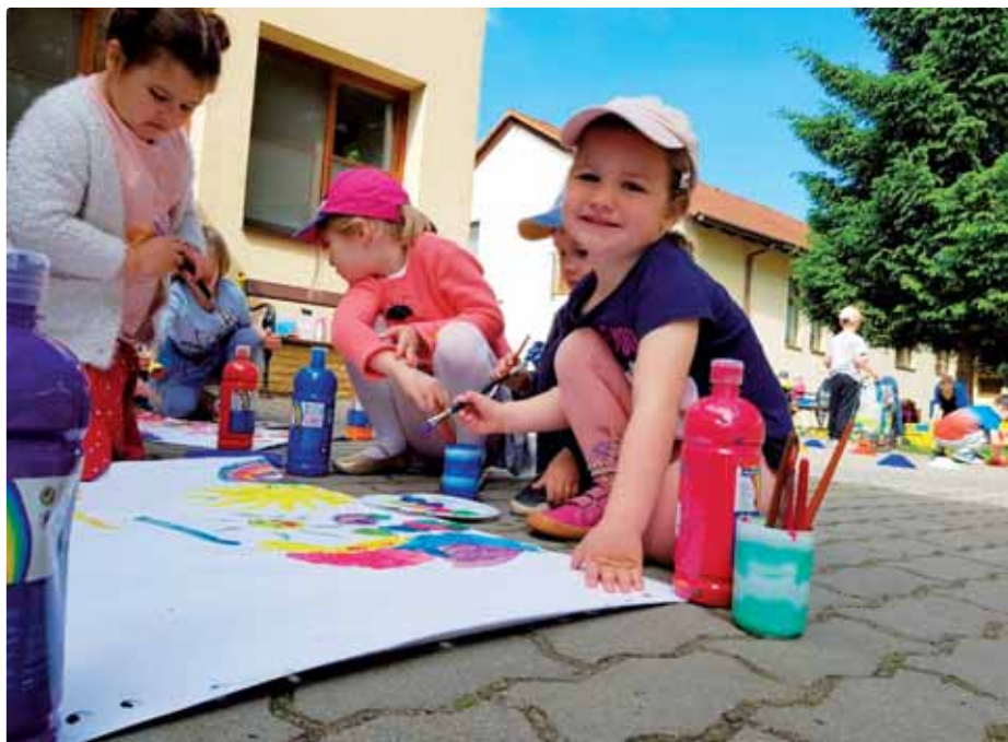
MDD v MŠ sv. Jána Pavla II.

Tento rok sme sa rozhodli zveladiť náš škôlkarský dvor. Pre deti sme dali vyrobiť lavičky k záhradnému domčeku, ktoré si deti vedú samy prenášať, pretože majú optimálnu veľkosť a váhu aj pre detské rúčky. Deti hneď zapojili fantáziu a vymysleli hry, v ktorých ich použijú. Najväčší úspech majú zatiaľ pri talianskej pizzerii v záhradnom domčeku. Čašníci vás usadia na lavičku a predstavia vám dennú ponuku. A naši cukrári vám z piesku vyčarujú dezerty od výmyslu sveta. Všetci ste srdečne pozvaní.