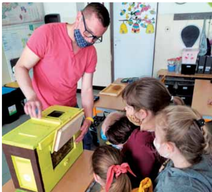
... záujemcov má

pre zber nektáru a peľu veľmi potrebné. Nehovoriac o lúkach, na ktorých sú prvým zdrojom nektáru a peľu jarné kvietky.