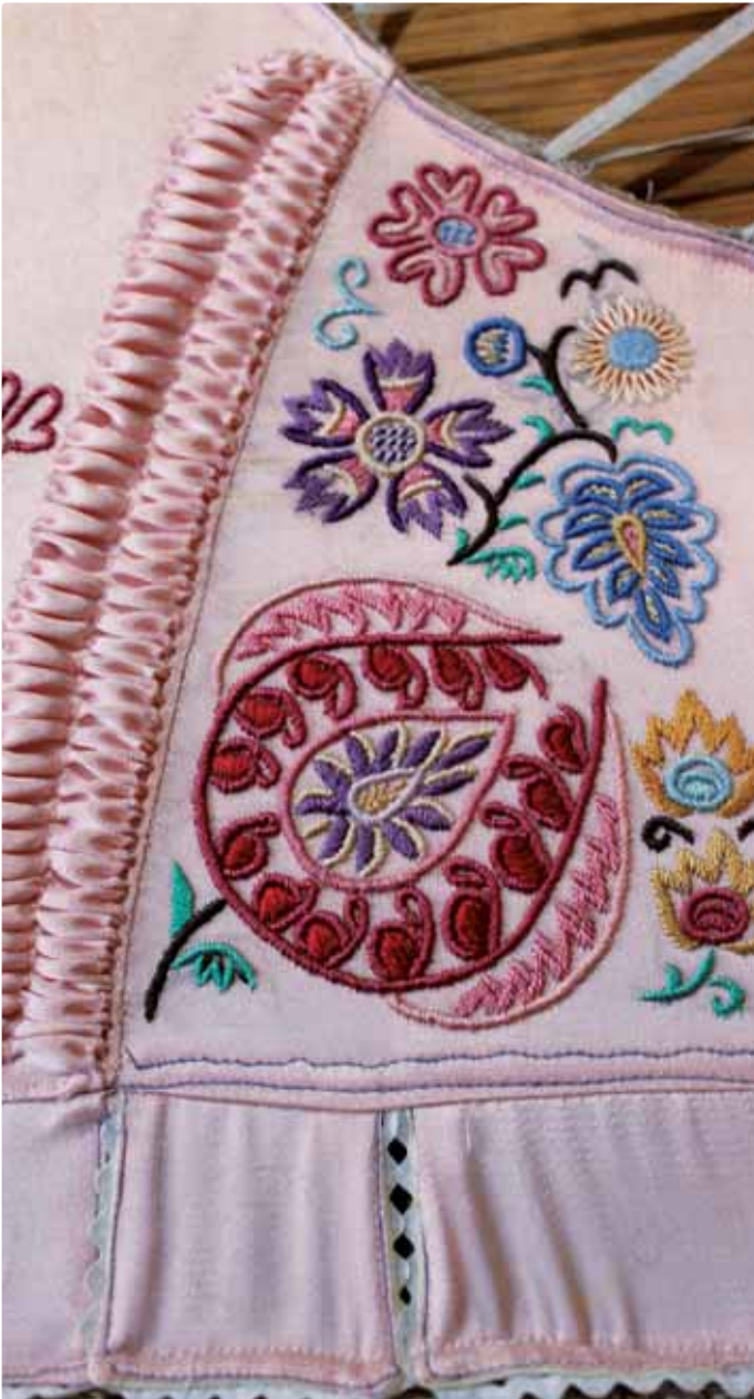
Pruclek – detail