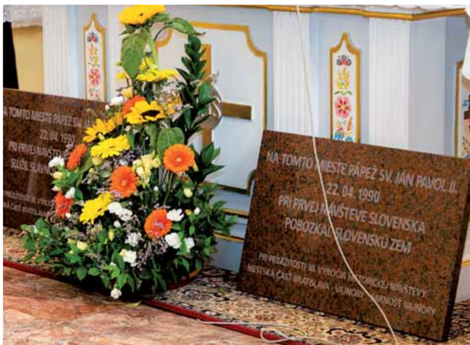
Posvätené pamätné tabule k príležitosti prvej návštevy sv. Jána Pavla II. na Slovensku

Relikvie prvého typu sú najvzácnejšie. Každá relikvia musí byť sprevádzaná dekrétom, ktorý potvrdzuje jej pravosť. Farnosť Bratislava-Vajnory požiadala o túto vzácnu relikviu osobného sekretára sv. Jána