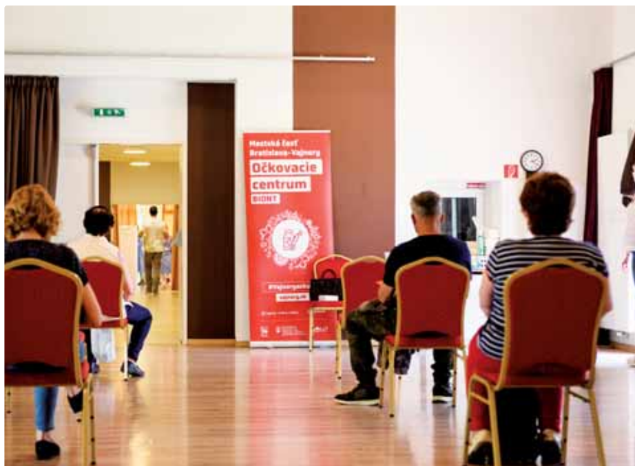
Čakáreň očkovacieho centra.

neným zaočkovať sa priamo vo Vajnoroch. Seniori tak nemuseli za očkovaním nikam cestovať, stačilo, ak sa objednali cez infolinku, ktorú zriadila mestská časť a už do pár dní mohli prísť do domu kultúry na prvú dávku.