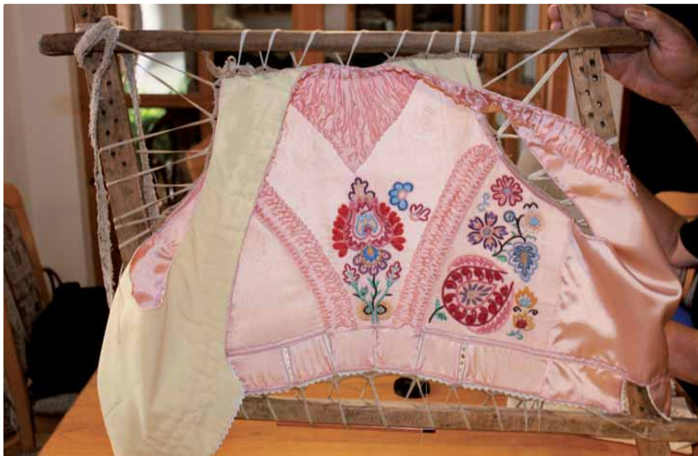
Pruclek – zadná časť