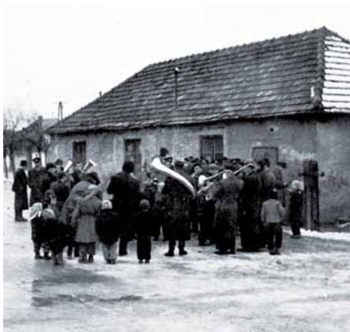
Pred hasičským depom, 1954