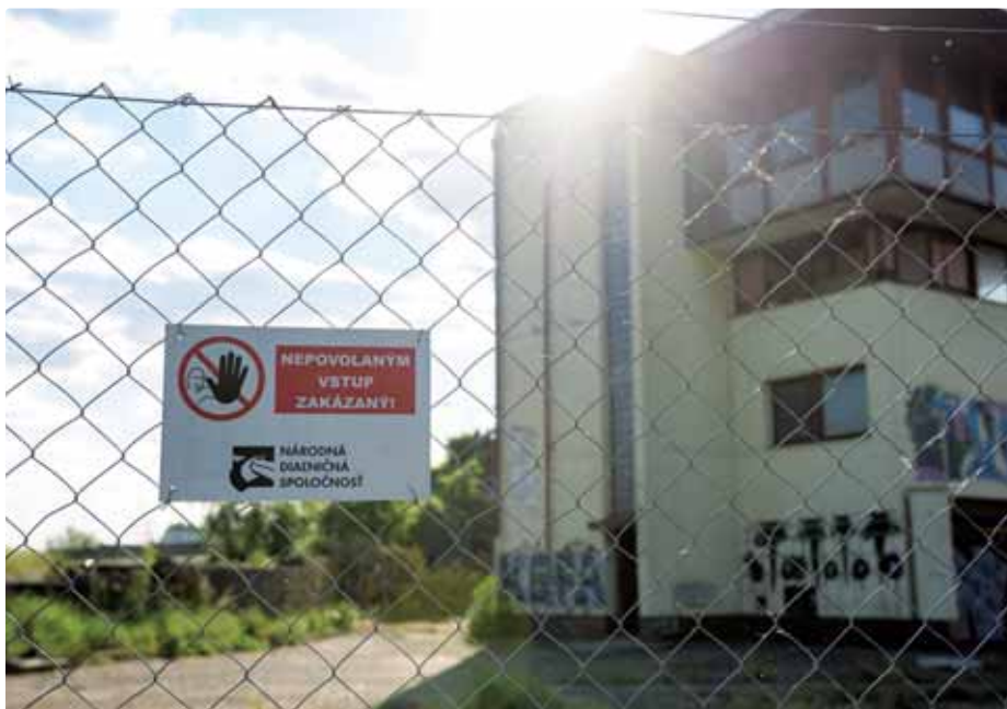
Oplotenie bývalej policajnej veže

Situáciu sme monitorovali nielen na základe podnetov občanov, ale aj z vlastnej iniciatívy. O stave areálu sme v pravidelných intervaloch informovali vlastníka areálu i okresný úrad. Veža, v súčasnosti patriaca NDS, je dlhodobo opustená, svoju funkciu neplní už viac ako dve desaťročia a počas posledných rokov sa stala jedným domovom a miestom pobytu rôznych ľudí, ako aj pochybných nočných stretnutí. Čo je však najhoršie, stala sa jedným veľkým skladiškom haraburdia, opotrebovaných a zničených vecí, starých pneumatík, chladničiek, práčok, smetí všetkého druhu a stavebného odpadu, inými slovami – nelegálnou čiernou skládkou. Miesto bolo odpadom natoľko zapratané, že na jeho odvezenie a zlikvidovanie boli potrebné tri kontajnery s obsahom 15 m 3 . Po dohode a v spolupráci s NDS a okresným úradom sme tento rok areál vy-