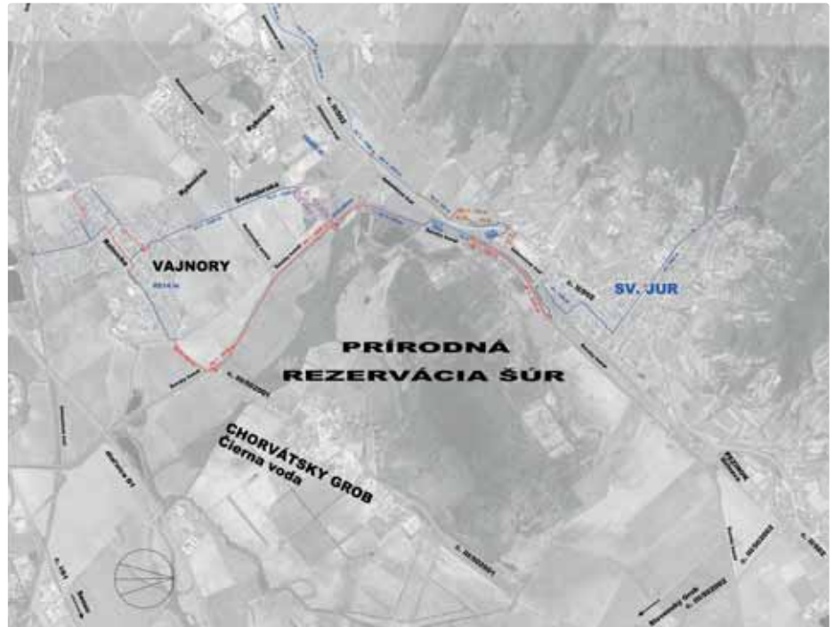
Malokarpatsko – šúrska cyklotrasa JURAVA