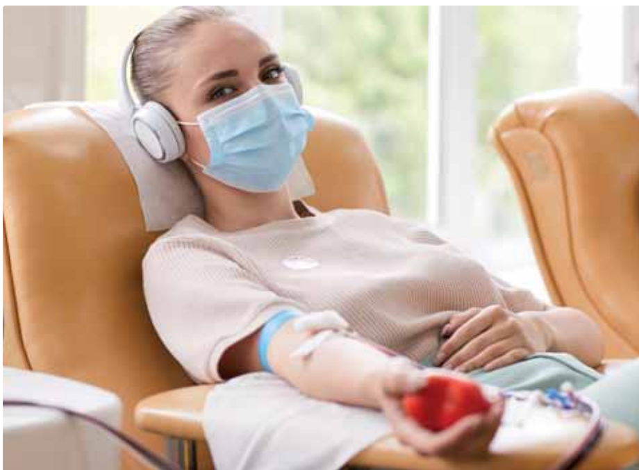
Ilustračná snímka

Darovanie krvi je skutočným „darom života“, ktorý zdravý jedinec môže poskytnúť ľuďom chorým a po úrazoch. Je to veľmi prospešný, bezpečný a jednoduchý humánny krok. Interval darovania je pre mužov každé 3 mesiace a pre ženy každé 4 mesiace.