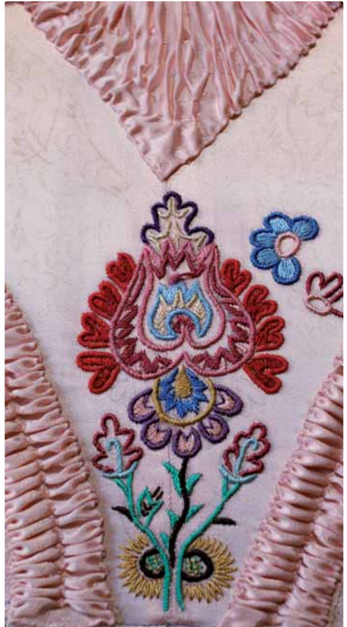
Pruclek – detail stredového kvetu

merne natiahnutá. Po vyšíť ju z rámu samozrejme čo najskôr stiahli. To, že dnes vidíme pruclek v ráme „nakrivo“, je spôsobené tým, že je v ňom upevnený už dlhý čas v jednej polohe. Vzhľadom na stav rámu by však nebolo účelné teraz zasahovať a pokúšať sa napnutie upraviť.