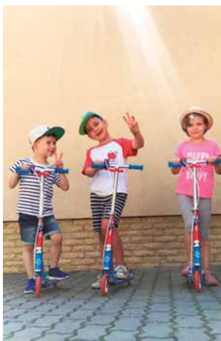
Nové veci na dvore škôlky