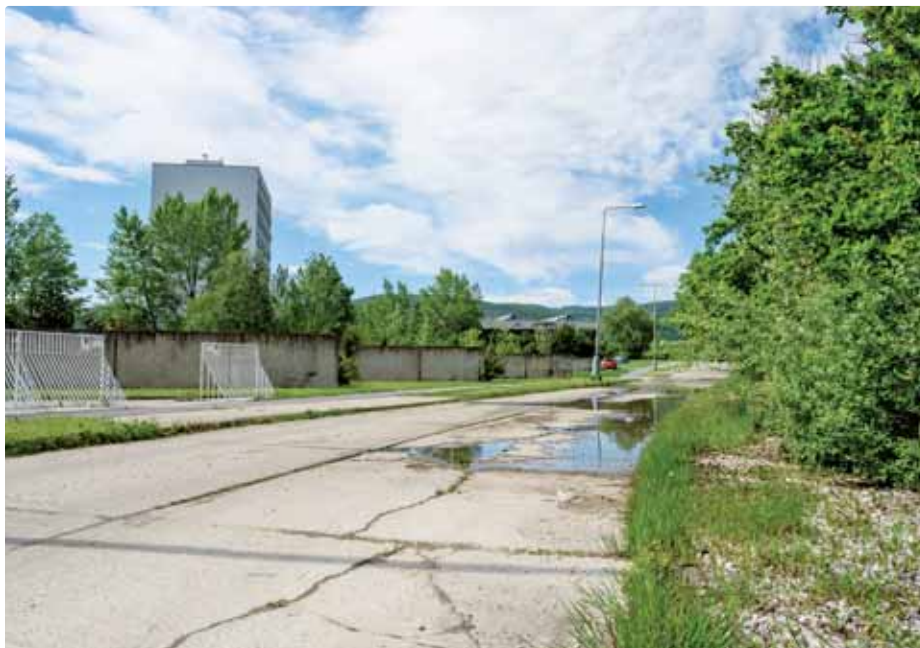
Presakovanie Vajnorského rybníka

Začiatkom mája tohto roku sme dostali na úrad upozornenie, že na ulici Na pántoch pred SOŠ dochádza k priesakom vody pravdepodobne z Vajnorských rybníkov. S kolegami z miestneho úradu, pracovníkmi SVP - štátny podnik a okresného úradu sme miestnym zisťovaním dospeli k záveru, že k priesaku naozaj dochádza a presakujúca voda z rybníkov ohrozuje okolitý majetok.