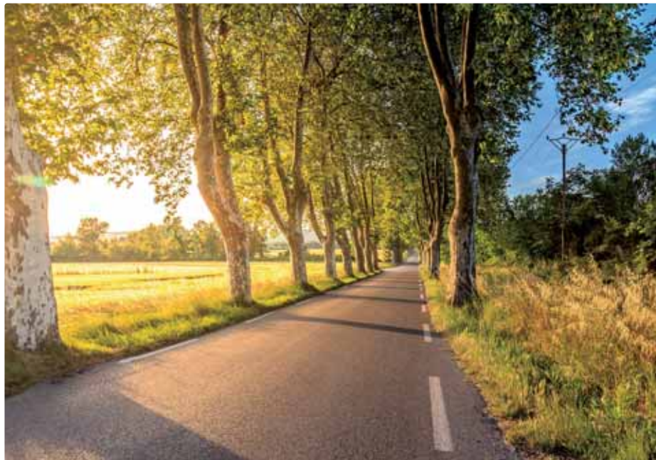
Ilustračná snímka