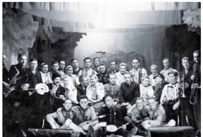
1. február 1942 – predstavenie Ej horička

„Pokým ľudia budú hercami a herci ľuďmi, bude divadlo.“ Karel Čapek