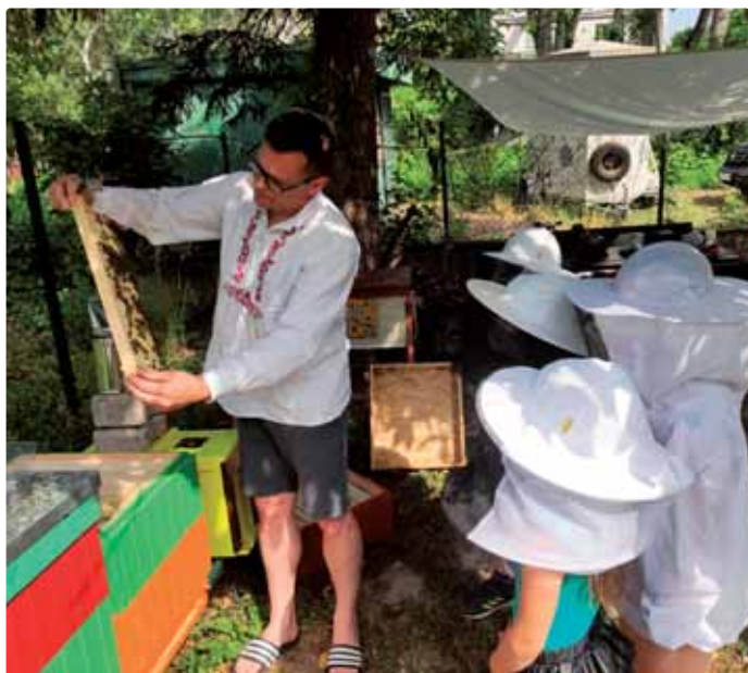
Od útleho veku treba deti priučať...