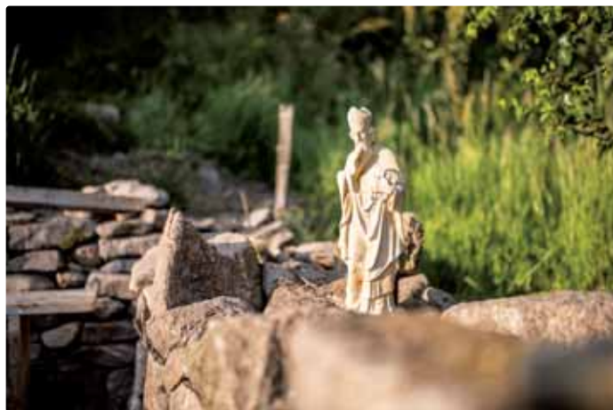
Soška sv. Urbana