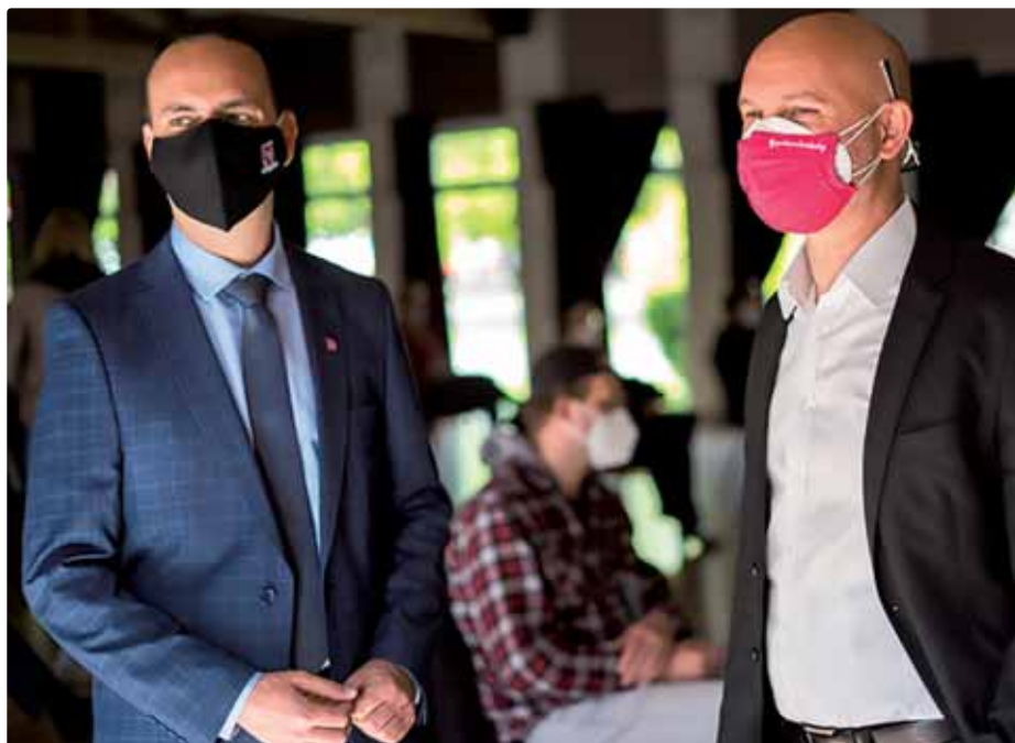
Minister školstva Branislav Grohling na návšteve očkovacieho centra vo Vajnoroch

kovania profitovali aj samotní obyvatelia našej mestskej časti. V prvej fáze očkovania ponúkala mestská časť možnosť seniorom nad 65 rokov a zdravotne znevýhod-