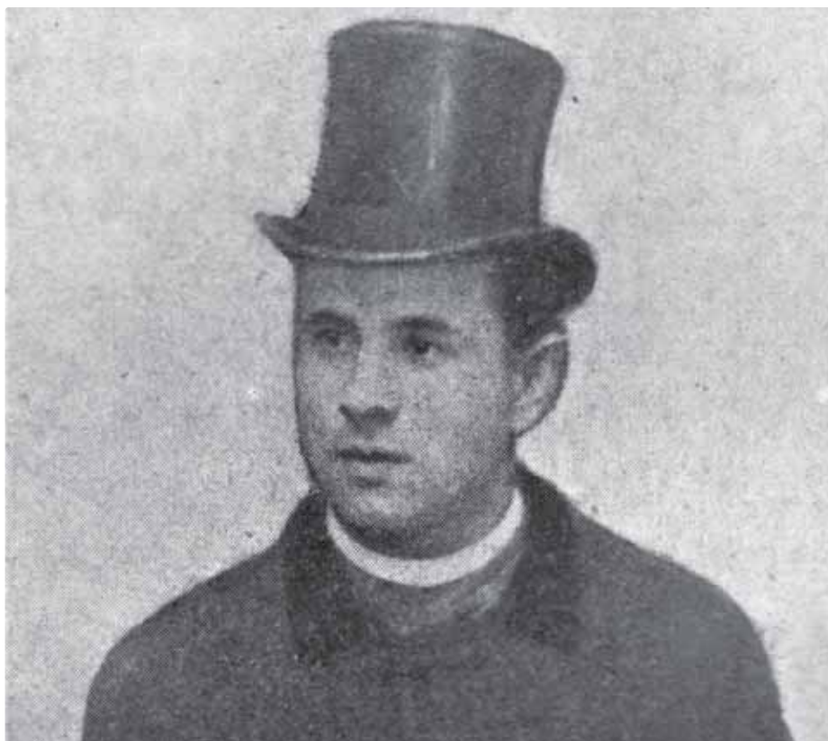
Ako študent prvého ročníka bohosloveckej fakulty na Pazmaneu vo Viedni

Pripomeňme si najprv niekoľko detailov z počiatkov Jurigovho života. Ferdiš Juriga pochádza z Gbelov pri Holiči neďaleko Šaštína. Narodil sa dvanásteho októbra 1874. V knihe Blahozvesť kriesenia slovenského národa a slovenskej krajiny, vydanéj Nakladateľstvom Urbánek a spol., Trnava v roku 1937 sa píše „Pri krste dali mu rodičia že vraj „pekné“ meno Ferdinand, čo sa vo Gbeloch vyslovovalo Ferdiš. Tomu menu sa Juriga vždy tešil, lebo vraj keby sa bol menoval Vendelínom Krupicom, nikdy by nebol býval z neho Ferdiš Juriga. A preto neskôr ako kňaz