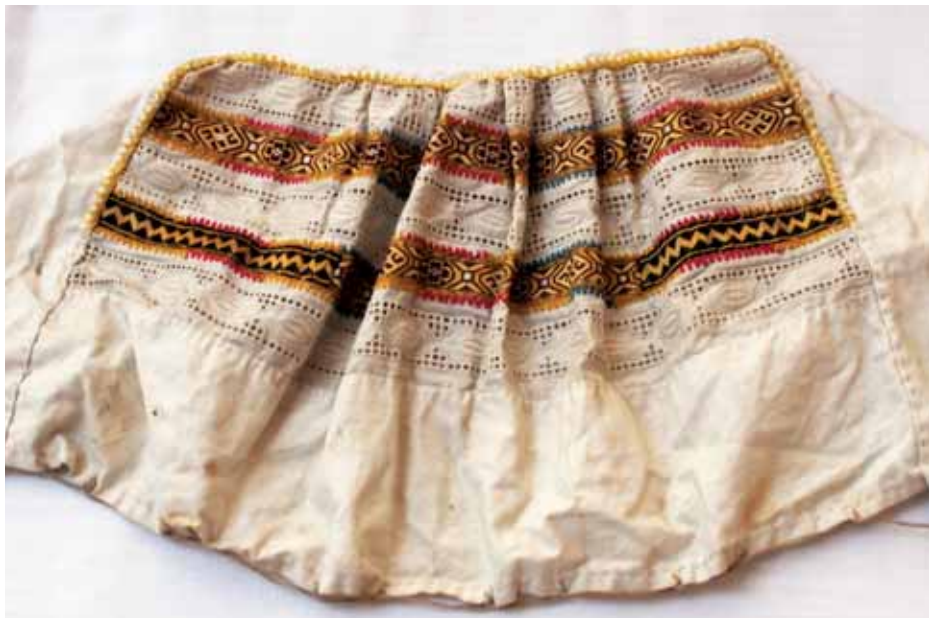
Dienko pracovného čepca, nálezový stav