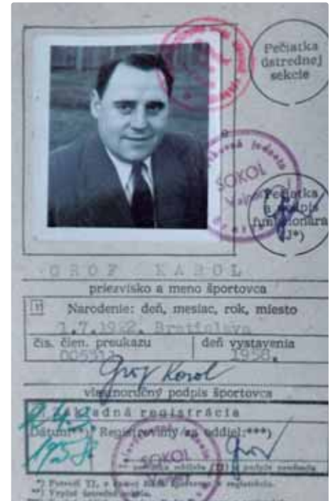
Preukaz funkcionára z roku 1958

Text: Richard Fekete