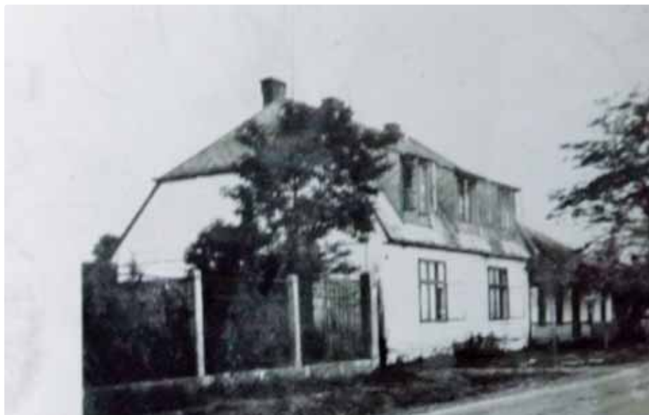
Dom pri letisku