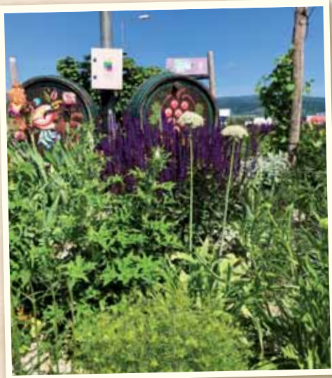
Krásne nám zakvitol kruhový objazd