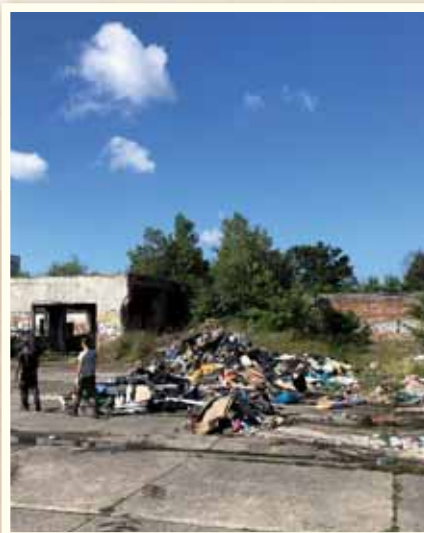
Odstránili sme odpad zo starého letiska