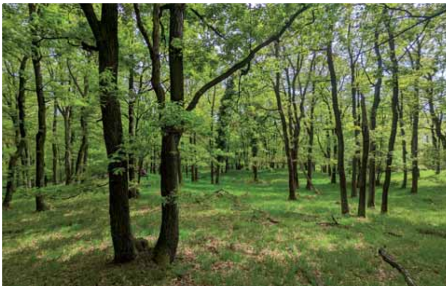
Riedky les nad vinicami