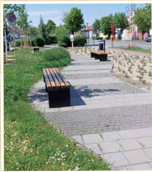
Osadili sme nové lavičky