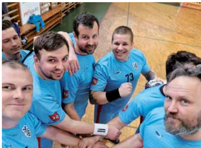
Dobrá nálada v zápase s BHA Bratislava