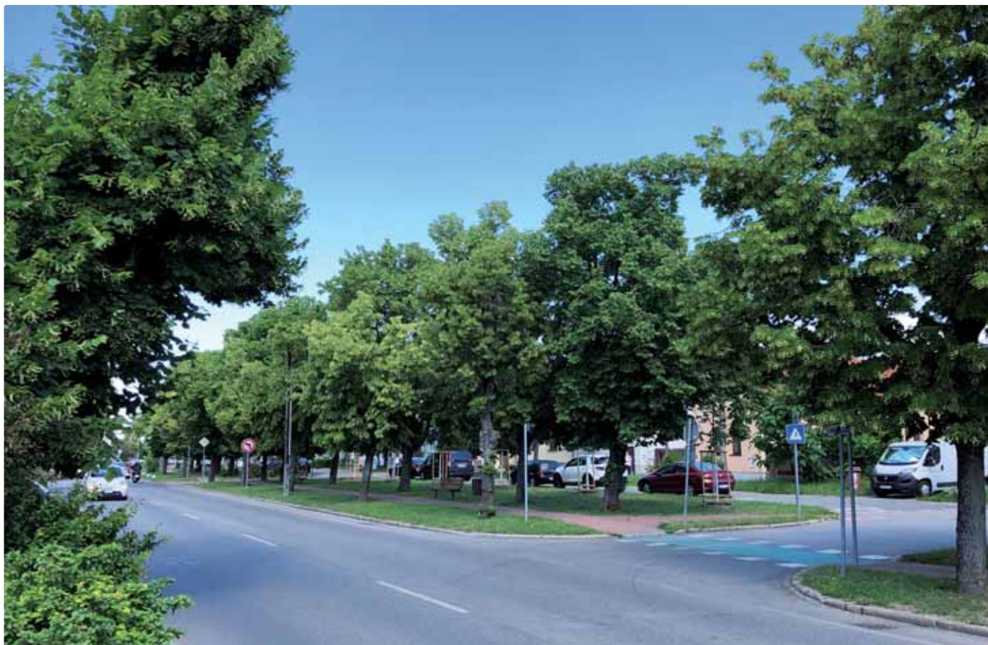
Roľnícka ulica v centre Vajnor by sa otvorením severného obchvatu zbavila tranzitnej dopravy

Ranné dopravné zápchy na Roľníckej ulici a neustála premávka na hlavnej dopravnej tepne Vajnor počas celého dňa. Taká je realita v Mestskej časti Vajnory, ktorá však nie je spôsobená primárne miestnymi obyvateľmi, ale dopravným tranzitom zo satelitných obcí Bratislavy ako je napríklad Chorvátsky Grob.