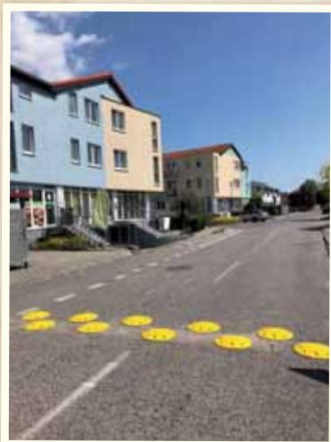
Pribudli nové spomaľovače