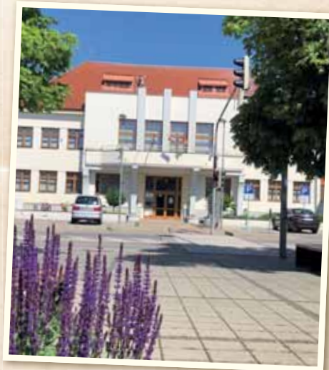
Úplne sme otvorili úrad verejnosti