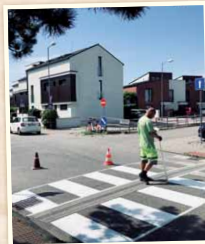
Na komunikáciách v správe mestskej časti obnovujeme priechody pre chodcov