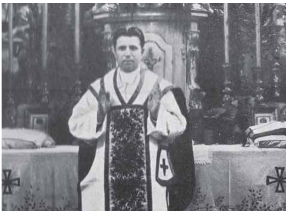
Kaplán v Slovenskom Mederi

Ale nielen vo Viedni demonštroval svoje slovanstvo a príslušnosť k slovenskému národu. Zároveň bol kritický voči vtedajšej pasivite, nepriebojnosti a nedostatočnej uvedomelosti medzi ľuďmi všetkých vrstiev. Už po maturite sa angažoval v politickom dianí na rôznych ľudových zhromaždeniach a napriek ohrozeniu, že bude trestaný, otvorene sa rozprával po slovensky aj na verejnosti. Ba, dokazuje to aj pred vrchnosťou, za čo sa mu dostane neraz vyhrážok.