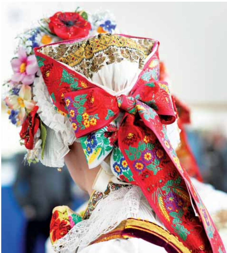
Žena vo vajnorskom čepci a tzv. predku

Sviatočný čepec bol zhotovený z jemnejšieho bieleho plátna a dienko mal vyšívané farebnými bavlnkami, najmä však