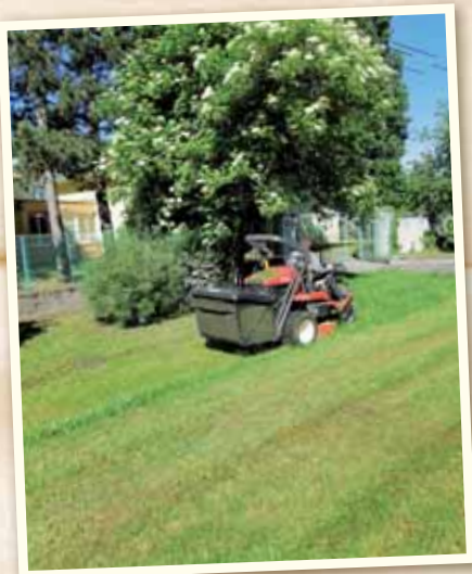
Pravidelne kosíme trávniky