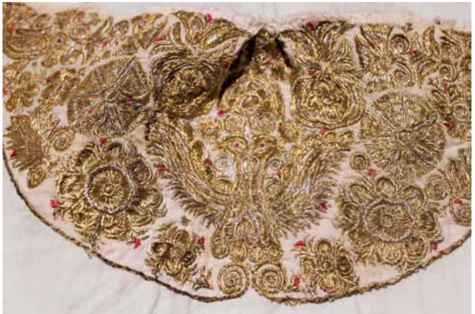
Dienko čepca s dvojhľavým orlom