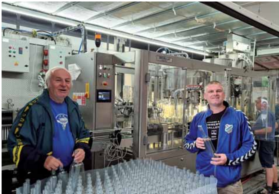
Fekete a Ondruška pri fľaškování vína

Motivácia a demotivácia pre ďalšie obdobie? Minulý rok počasie vcelku prialo. Takže hlav-