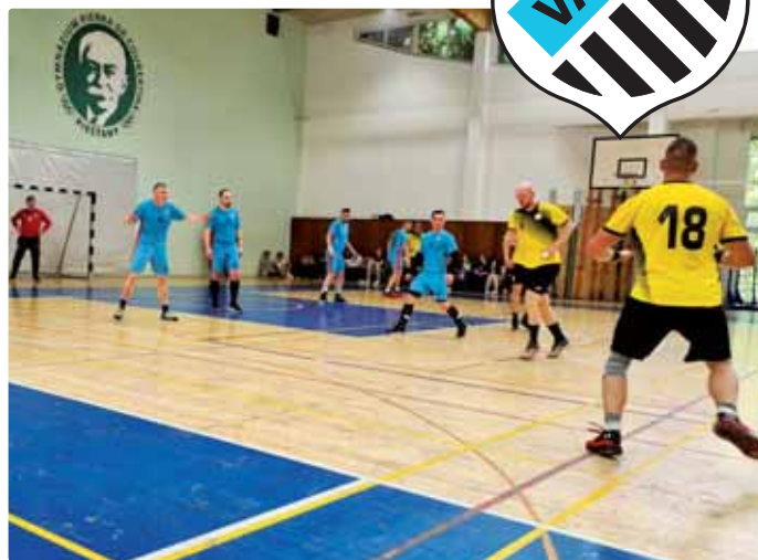
Zo zápasu v Piešťanoch

Text: Miroslav Horňák, Snímky: Václav Fekete