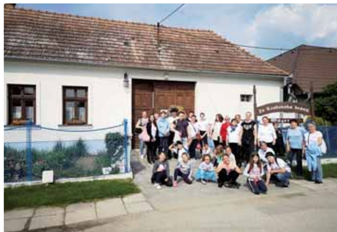
Pred Múzeom v Krakovanoch