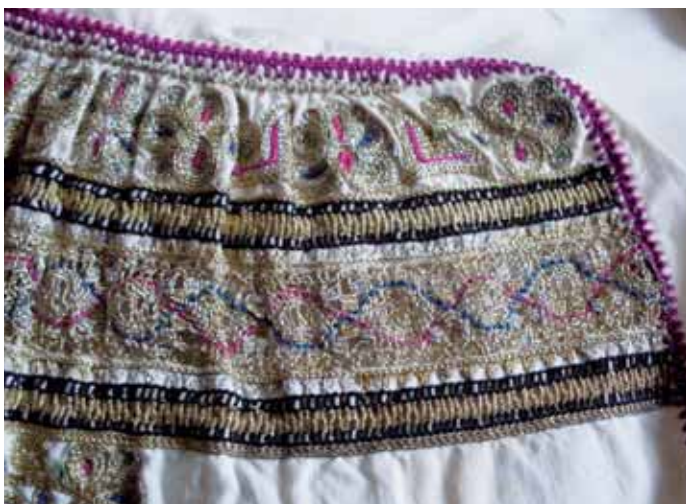
Detail čepca s vloženou paličkovanou čipkou, výšivka krivou ihlou a výšivka po vytiahnutých niti