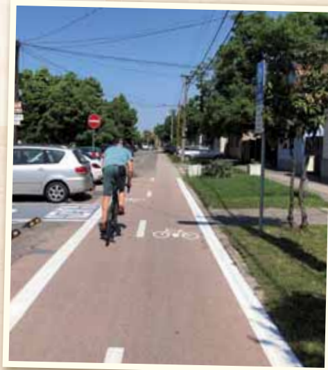
Na viacerých miestach sme urobili obnovu dopravného značenia