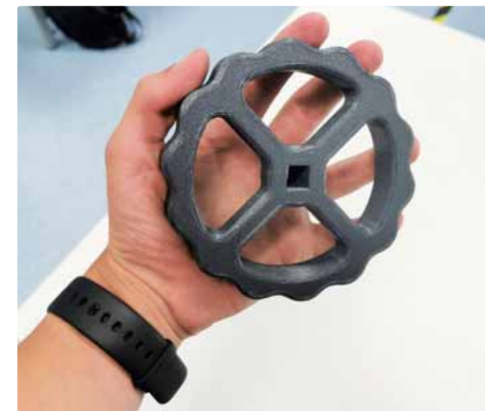
Takúto časť ventilu možno vyrobiť na 3D tlačiarňi

k tomu, spojím štyri veci a niečo sa začne diať. Podarilo sa mi zostrojiť jednoduchý prístroj – ventilátor. Krútilo sa to, fúkalo. Tešilo ma to, páčilo sa to aj spolužiakom. Robil som to, čo ma zaujímalo, a postupne prichádzali náročnejšie konštrukcie.