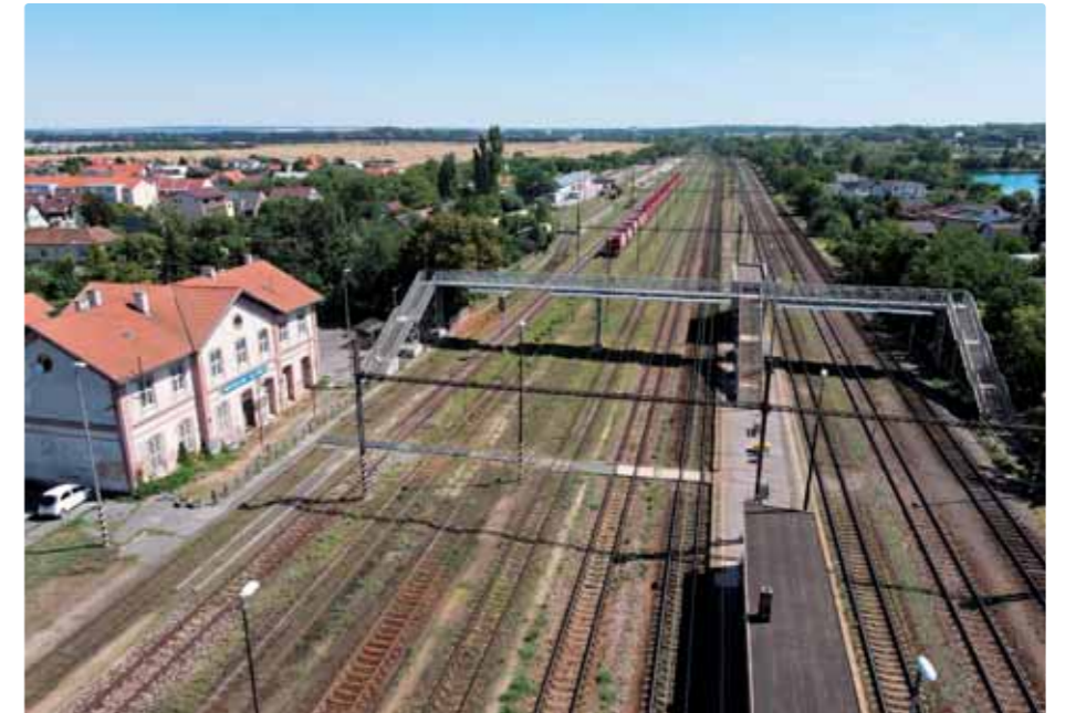
Železničná stanica vo Vajnoroch