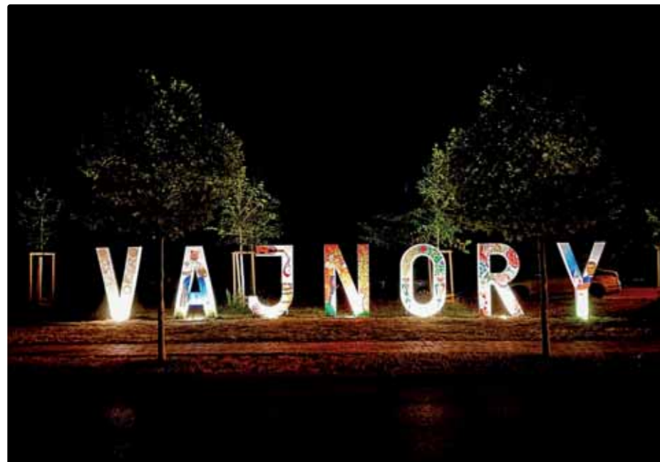
Nápis VAJNORY svieti aj v noci