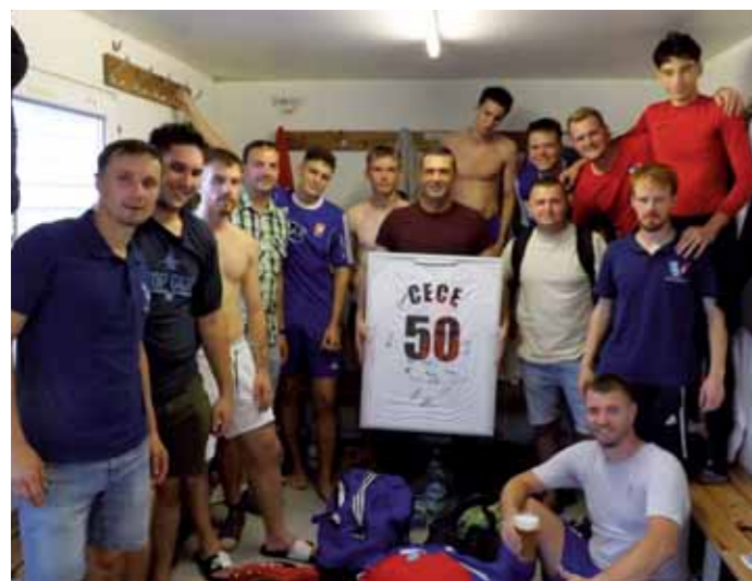
Tréner dostal k 50-tke podpísaný dres Realu Madrid

Ak by som dostal dôveru pri organizovaní kempu aj budúci rok, tak cieľ bude rovnaký. A to zabaviť a naučiť deti niečo nové, lebo len tak sa k nám vrátia opäť.