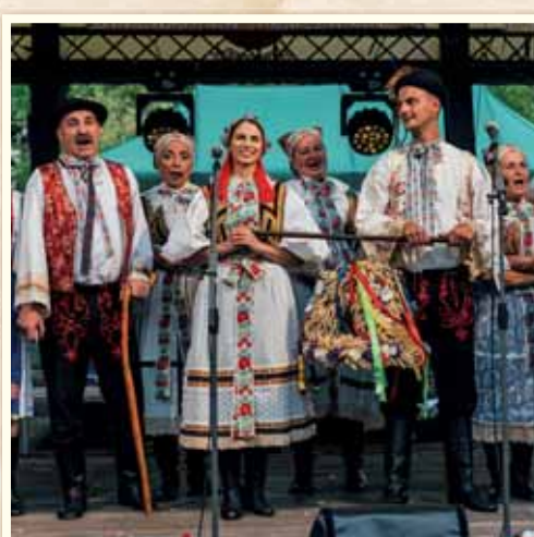
Návštevníkov potešil aj Vajnorský okrášľovací spolok