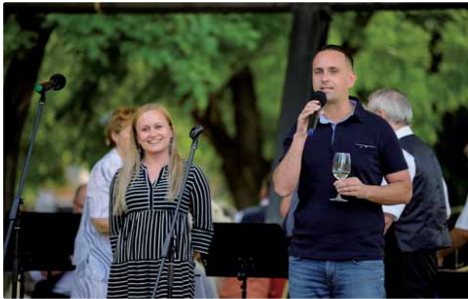
Na letnej kultúrnej akcii Vína v parku

Vždy, pri každej práci, keď sa spätne obzrieme, sa dá povedať, že snáď by sa niektorý projekt mohol zrealizovať lepšie a kvalitnejšie. Nečakane nás v roku 2020 zasiahla pandémia, ktorá nám skrížila mnohé plány. Frustrovalo nás, že takmer polovicu volebného obdobia sme boli nútení riešiť veci, ktoré nikto neočakával, a museli sme, či už pri covid-e alebo pri pomoci ukrajinským odídencom suplovať štát. No a neskôr sme boli sklamaní z toho, že napriek pomoci, ktorú sme štátu poskytli, nám na oplátku hádzajú pod nohy ďalšie a ďalšie polená.