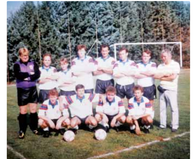
Sústredenie v Alviáne