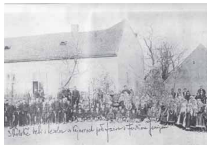
Vajnorskí žiaci s Lesolou