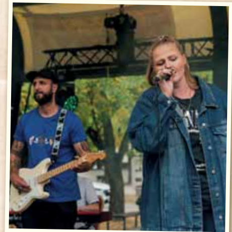
Vystúpenie skupiny Saymi