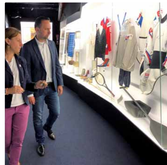
Prehliadka olympijského a športového múzea