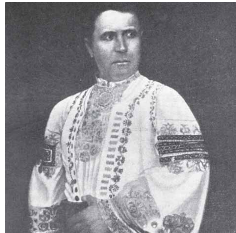
Juriga vo vajnorskom kroji, v ktorom príležitostne aj vysluhoval bohoslužby

Akú významnú úlohu plnila tlač, si Juriga uvedomoval už na predchádzajúcich pôsobiskách. Veriacich podnecoval, aby čítali. Dokonca pri spovedi namiesto otčenášov, zdravasov a iných modlitieb podnecoval, aby si predplatili slovenskú tlač, ktorú v tom čase predstavovali najmä Katolícke noviny. Tieto užitočné noviny dokonca