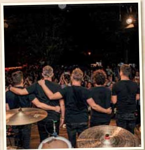
Koncerty trvali do neskorých nočných hodín