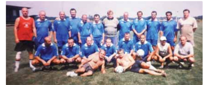
Starí páni FK Vajnory niekedy okolo roku 2005