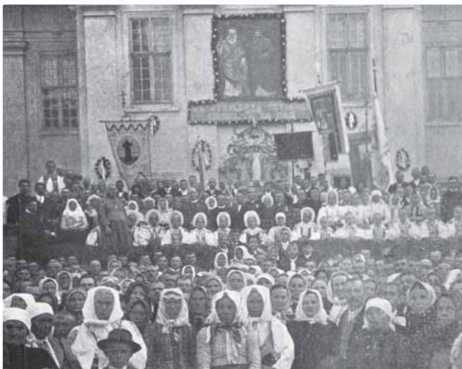
Pamätná púť vo Velehrade, na ktorej sa zúčastnila početná skupina Vajnorákov

Jeho rozhodnutie odstraňovať trecie plochy medzi jednotlivcami i skupinami podporila aj udalosť vo Vajnoroch síce bežná, no zároveň aj výnimočná tak krojmi, ako aj zvykmi – svadba. Po príchode sa porozprával s odchádzajúcim pánom farárom, aby vzápätí prišla za ním deputácia s pozvaním na svadobnú hostinu u Jaslovských. Samozrejme, že neodmietol, lebo sa mu naskytla príležitosť spoznať nielen situáciu, ale aj jej aktérov osobne. Predchádzajúce zvesti o táboroch v protivenstvách sa mu len potvrdili a tak sa rozhodol, že začne konať ihneď. Po príchode zistil, že skupinky boli pousádzané podľa svojich zámerov i presvedčení, najmä dve najodlišnejšie, a tak bez okolkov rozhodol: „Viete čo, dajme tie dva stoly dokopy. Ja si sadnem doprostredka a títo jeden na pravicu a druhý na ľavicu. Kto bude proti nám, ten pôjde pod lavicu. Pomiešal okolo seba strýčkov – protivníkov, ktorí ako vyjavení hladeli, čo to len bude. Za krátku chvíľu začal im spievať piesne, ktoré aj oni vedeli. A čo hnev rozdvajil, to spev spojil. Ako boli dohromady hnevníci pomiešaní, tak si museli na jeho posmelovanie dokopy štrngnúť. S kým si náš Slovák úprimne štrngne, tomu z hnevu popustí. Ktorí sa už od rokov ne-zhovárili, jazyky sa im, pravda, aj tak trochu pod vínom rozviazali a prestali si byť hnevníkmi“, tak hovoria dobové dokumenty. Okrem toho na nedelnej omši kázal na túto tému a vstupoval do svedomia bývalých i možných budúcich hnevnikov, že: „...základnou vlastnosťou a povinnosťou kresťana (a nie-