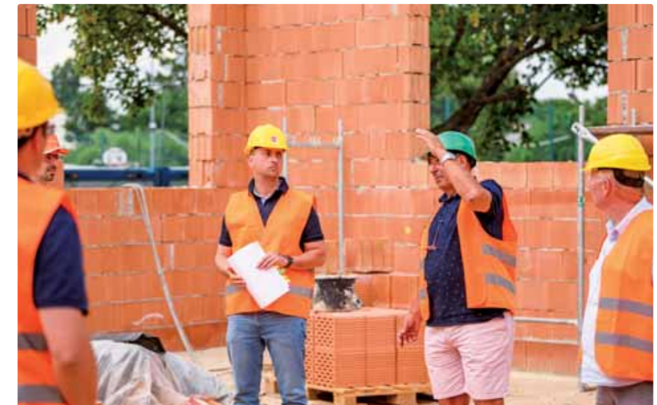
Na kontrolnom dni na prístavbe základnej školy

➤ Keď hovoríme o cove, okrem spomenutého školstva a dôležitosti rozvoja športu je veľkou témou zdravotníctvo a sociálna oblasť, pohli sa nejakou veci aj v tejto oblasti? Čo samospráva robila v čase pandémie, aby uľahčila život obyvateľom mestskej časti?