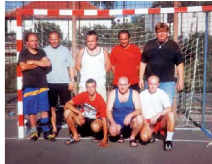
Turnaj na hádzanárskom ihrisku