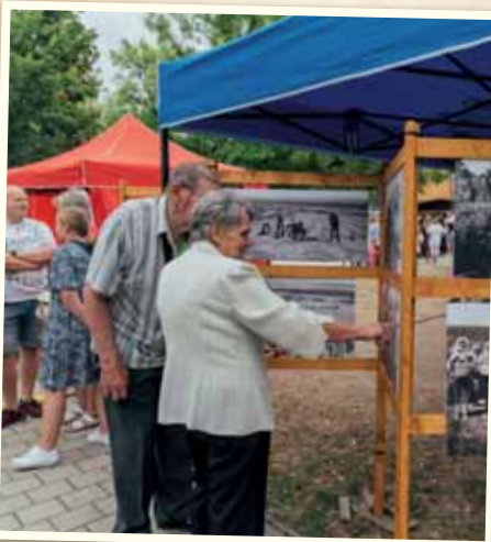
Návštevníci si mohli pozrieť aj zaujímavú výstavu z histórie Vajnor