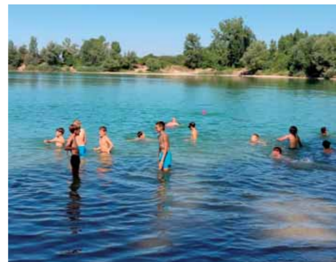
Kúpanie v jazere