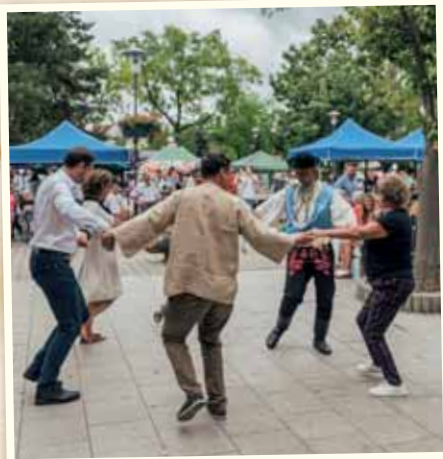
Na dychovku sa aj tancovalo