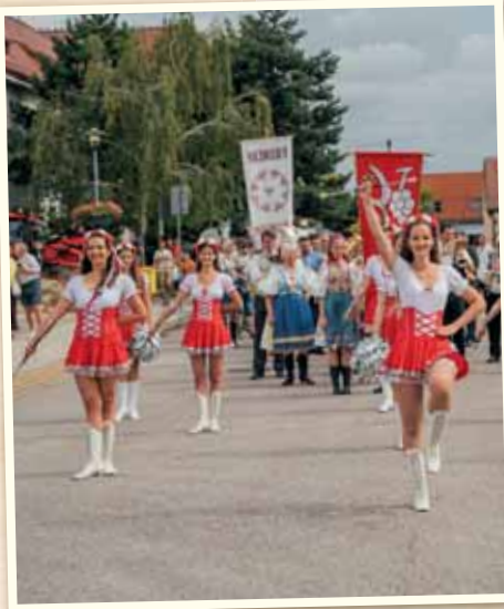
Podujatie začalo alegorickým sprievodom