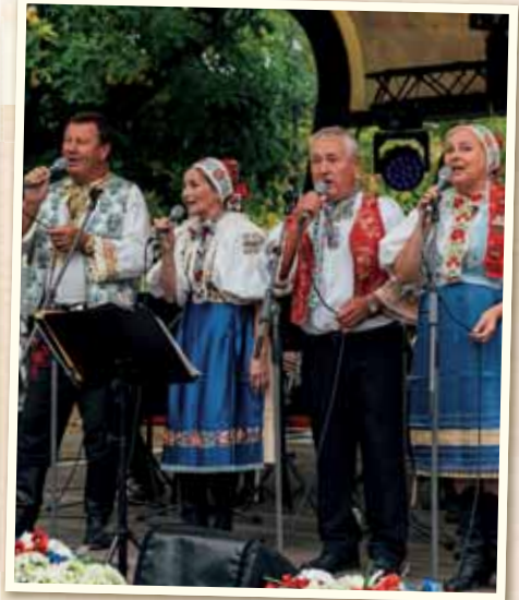
Vystúpenie Vajnorskej dychovky