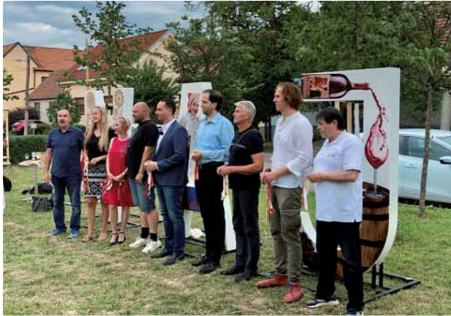
Slávnostné uvedenie nápisu Vajnory na začiatku leta

Od začiatku leta zdobí našu dedinu v meste na Roľníckej ulici nový nápis Vajnory. Vytvoril ho kolektív autorov, ktorých sme oslovili s otázkou, ako písmenká vznikali a čo symbolizujú.