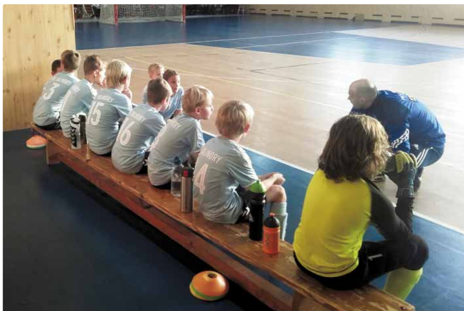
Zimná halová liga

Podrobné vyžrebovanie, presné dátumy a časy stretnutí, i všetky ďalšie informácie nájdete na našej stránke www.fkvajnory.sk . Príďte povzbudiť naše tímy. Tešíme sa na vašu návštevu aj v roku 2020.