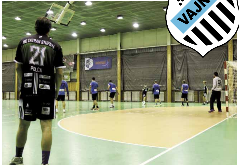
Odvetu so Stupavou sme zvládli

V ôsmom kole nás opäť čakal veľmi silný súper, a to družstvo Malaciek, ktoré vypadlo