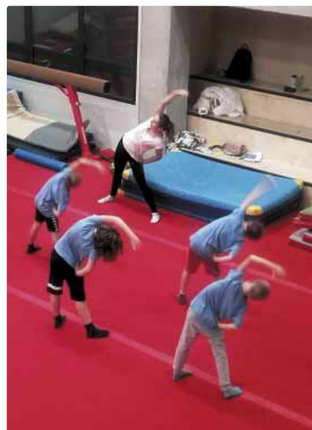
Gymnastická príprava v hale HangAir