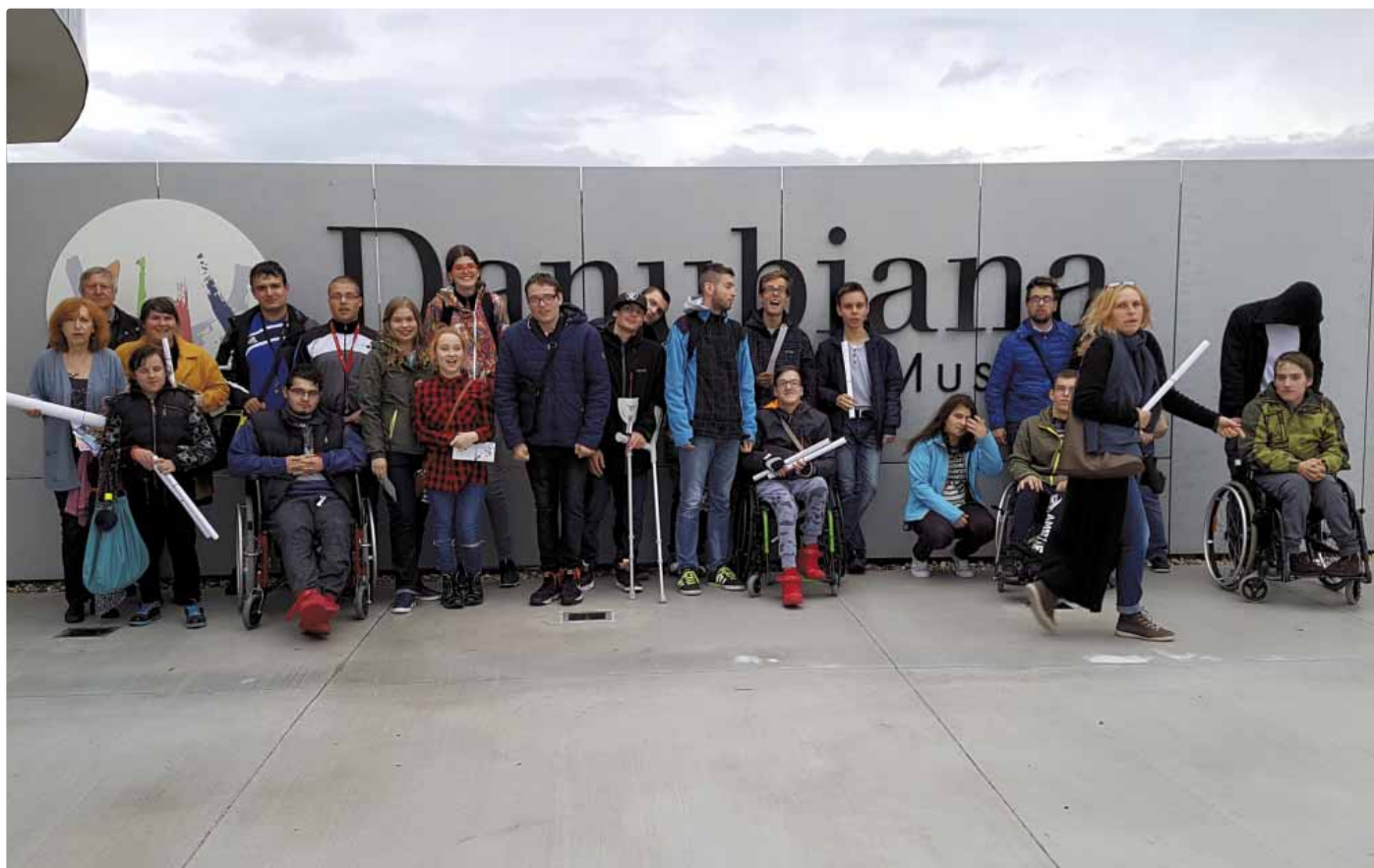
Na exkurzii v Danubiane