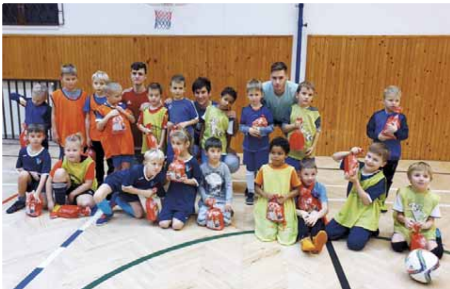
Zimné tréningy v telocviční

Tretí ročník futbalovej megapárty bol najvydarenejší. Tentoraz sme dostali k dispozícii veľkú sálu Domu kultúry v piatok 8. novembra. Znovu sme sa stretli a dobre sa zabavili nielen my, čo sa pohybujeme okolo vajnorského futbalu, ale aj iní, priatelia, známi, či takí, ktorým podobná akcia jed-