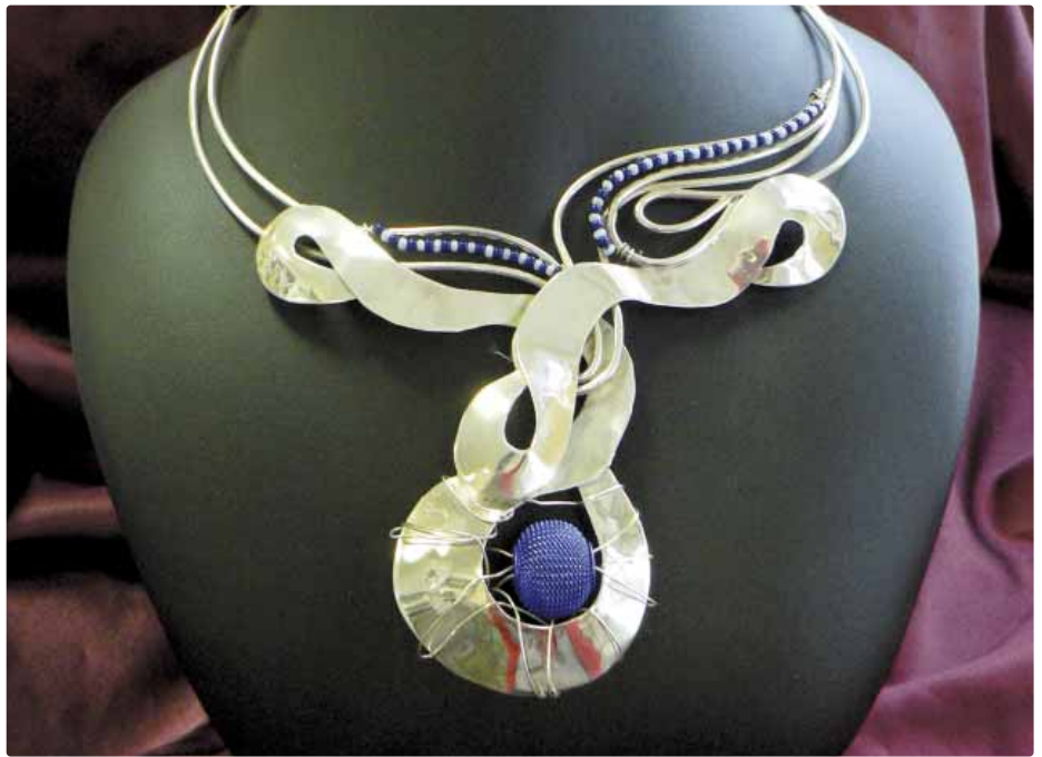
Žiaci z odboru zlatník získavajú v celoslovenskej súťaži Študentský šperk každoročne popredné umiestnenia

Po skončení teoretického a praktického vyučovania pokračuje výchovno-vzdelá- vacia činnosť na úseku výchovy mimo vyu- čovania (školský internát), ktorú zabezpe-