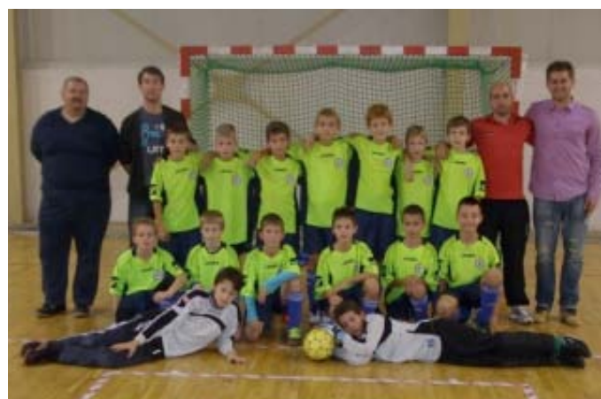
Mužstvo: ObFZ Bratislava.