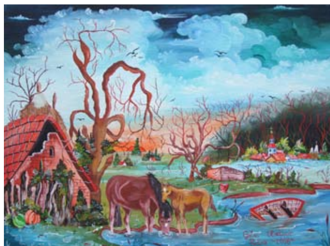
„Pri potoku“, olejomalba, 2008

Žije v Padine. Patrí medzi mladšiu generáciu maliarov, zoskupených do kovačickej galérie. Venuje sa krajinomalbe, do ktorej umiestňuje dedinské žánrové výjavy. Vystavoval v Kanade, Mexiku, Nemecku, na Slovensku a v Srbsku.