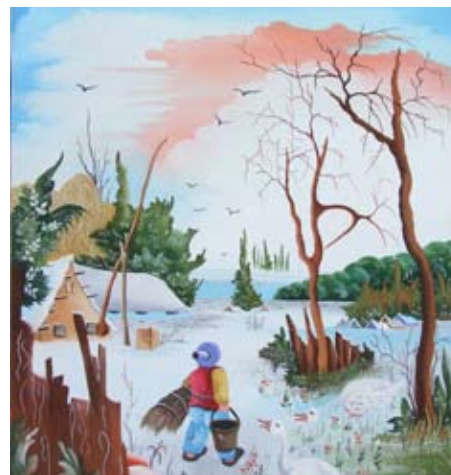
„Zima v Padine“, olejomalba, 2008