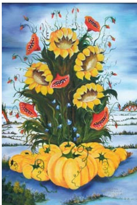
„Úroda“, olejomalba, 2008

V Galérii TYPO&ARS na Roľníckej 349 vo Vajnoroch sme pripravili medzinárodnú výstavu „Insita z Kovačice a Padiny“, ktorú slávnostne otvoríme 7. marca o 16.00 h.