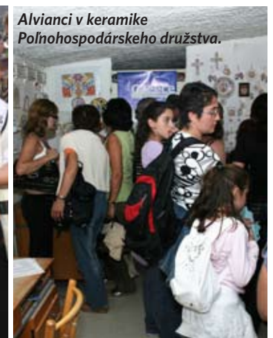
Alviani v keramike Poľnohospodárskeho družstva.