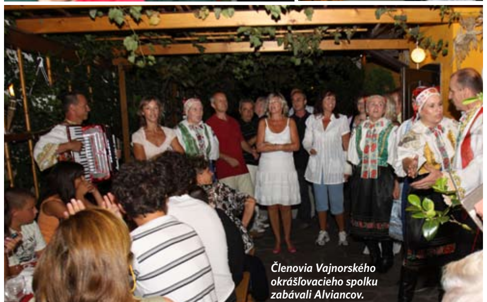
Členovia Vajnorského okrášľovacieho spolku zabávali Alviancov.