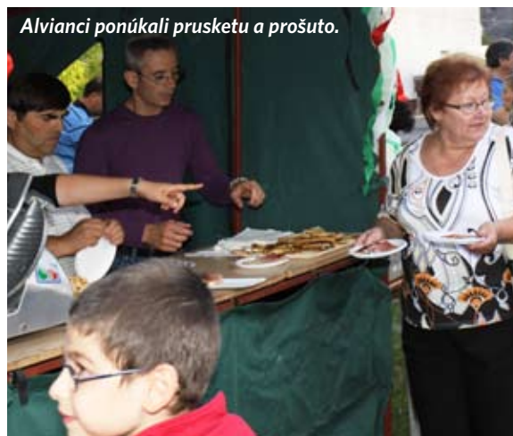
Alviani ponúkajú prusketu a prošto.