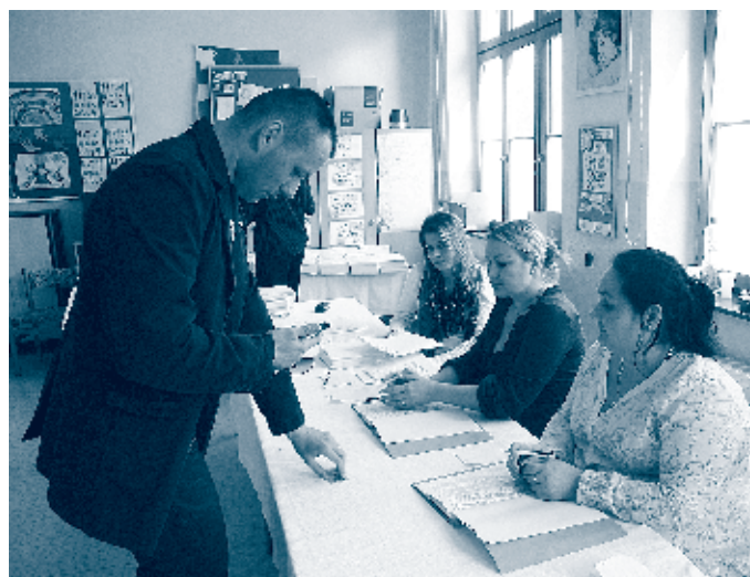
Vo volebnej miestnosti v ZŠ Jána Pavla II., k článku Volby do Národnej rady SR na s. 19.