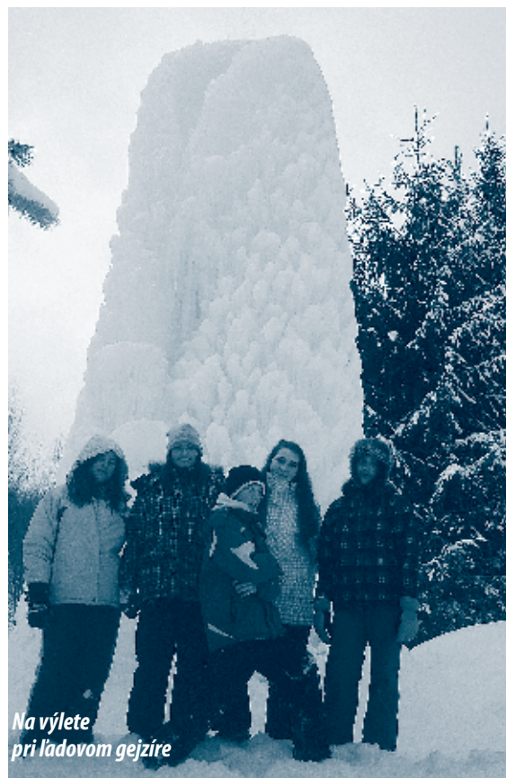
Na výlete pri ľadovom gejzíre