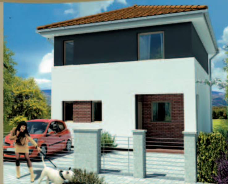
Vizualizácia má ilustračný charakter.