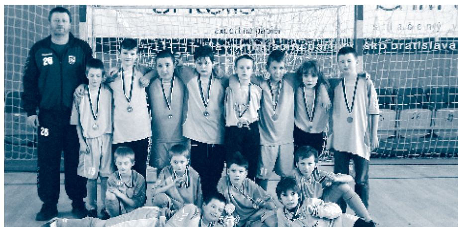
Na záver kvalitnej zimnej prípravy absolvovali halové turnaje.