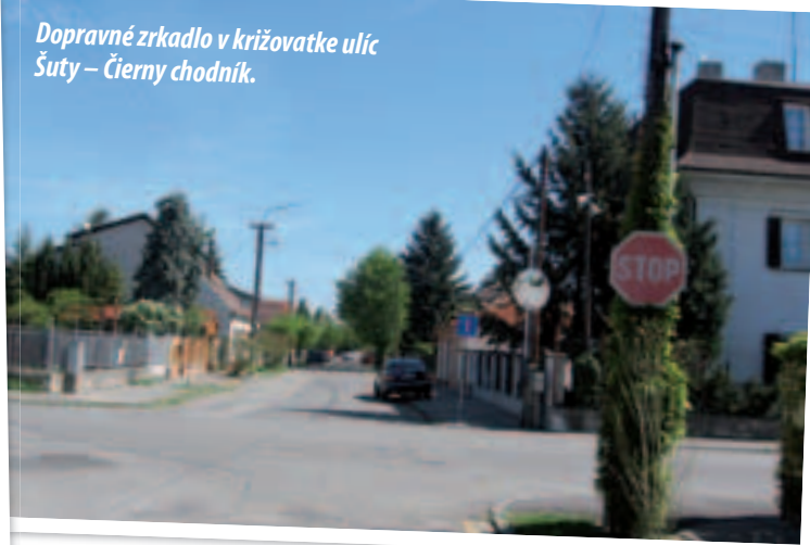
Dopravné zrkadlo v križovatke ulíc Šuty – Čierny chodník.