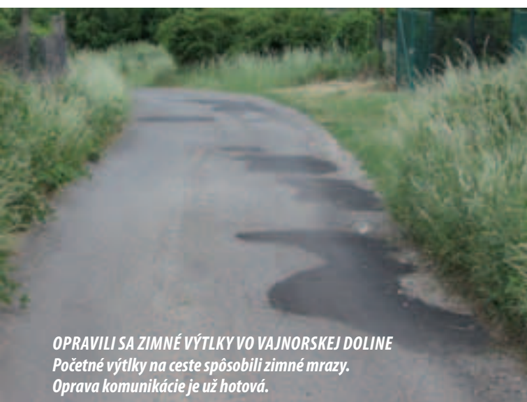
OPRAVILI SA ZIMNÉ VÝTLKY VO VAJNORSKEJ DOLINE Početné výtlky na ceste spôsobili zimné mrazy. Oprava komunikácie je už hotová.