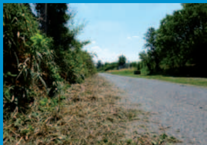
Vajnory opravili cestu a Rača pokosila obe strany cesty do Kobyláckej doliny.