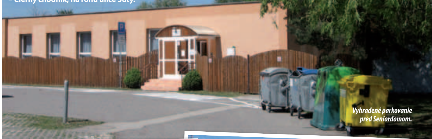
Vyhradené parkovanie pred Seniordomom.

Vo Vajnorochoch sme zrealizovali nové dopravné opatrenia. Ide o vyhradené parkovanie 3 boxy pred Seniordomom na ulici Alviano, o spomaľovací prah so zvislou DZ na ulici Kratiny, dopravné zrkadlo v križovatke ulíc Šuty – Čierny chodník, na rohu ulice Šuty.