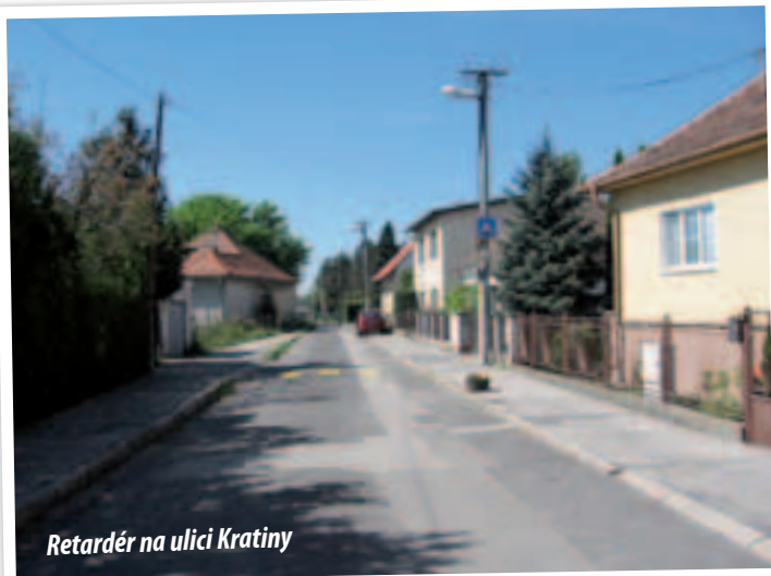
Retardér na ulici Kratiny