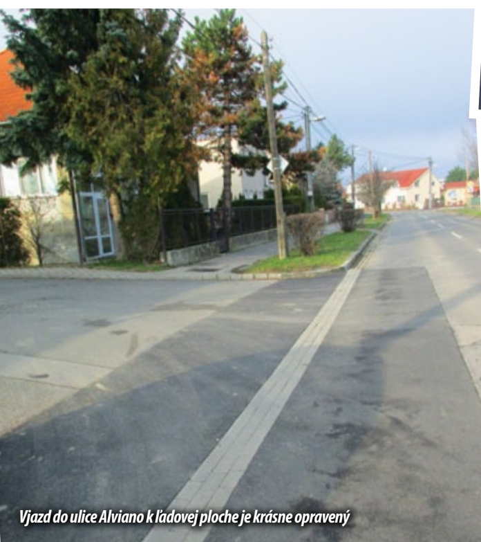
Vjazd do ulice Alviano k ľadovej ploche je krásne opravený