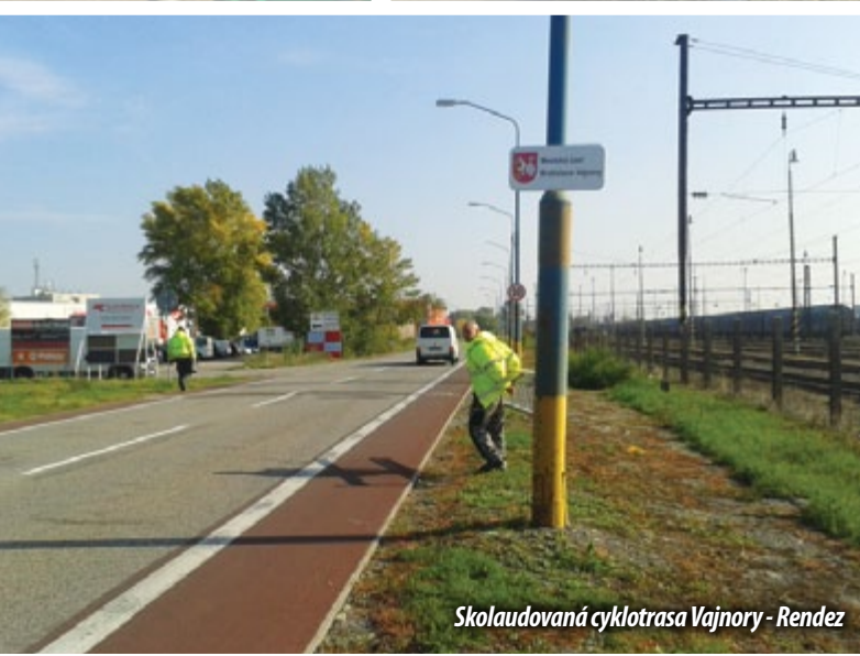
Skolaudovaná cyklotrasa Vajnory - Rendez