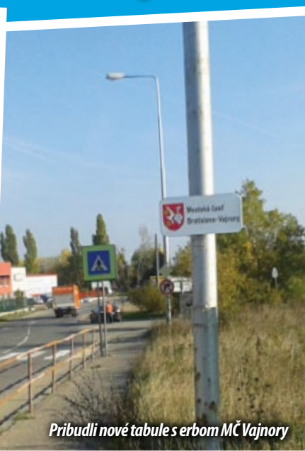
Pribudli nové tabule s erbom MČ Vajnory