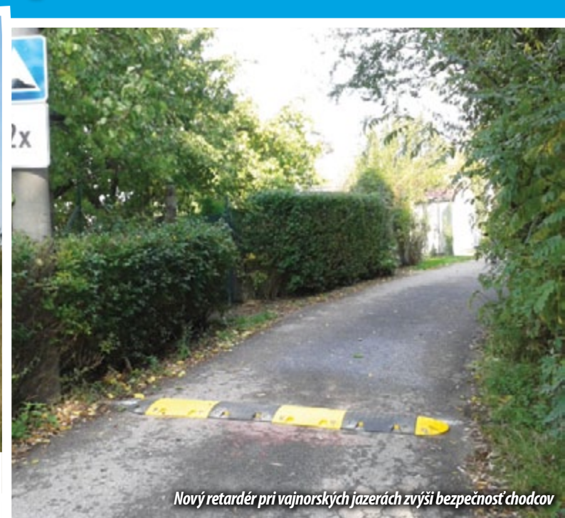
Nový retardér pri vajnorských jazerách zvýši bezpečnosť chodcov