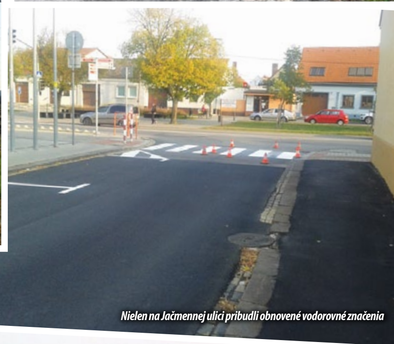
Nielen na Jačmennej ulici pribudli obnovené vodorovné značenia