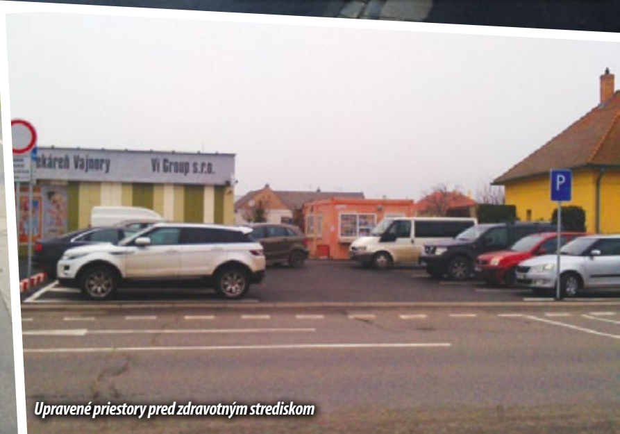
Upravené priestory pred zdravotným strediskom