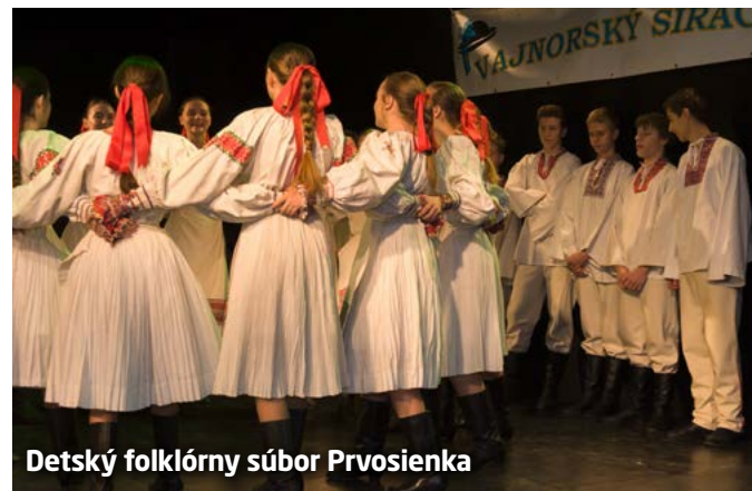
Detský folklórny súbor Prvosienka