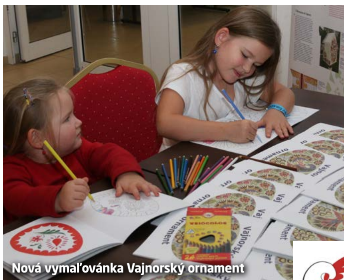
Nová vmaľovánka Vajnorský ornament

Dovidenia o rok na Vajnorskom širáčku 2018!