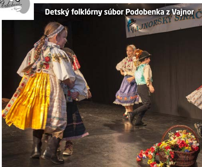
Detský folklórny súbor Podobenka z Vajnor