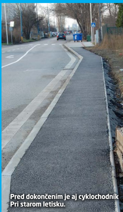
Pred dokončením je aj cyklochodník Pri starom letisku.