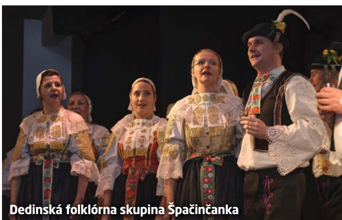
Dedinská folklórna skupina Špačinčanka