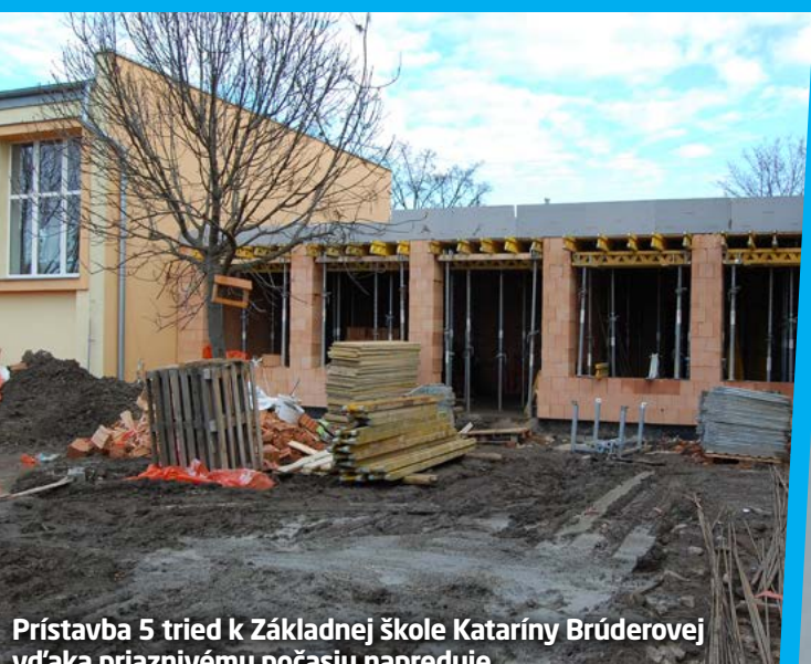
Prístavba 5 tried k Základnej škole Kataríny Brúderovej vďaka priaznivému počasiu napreduje.