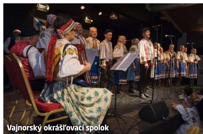
Vajnorský okráš'ovací spolok