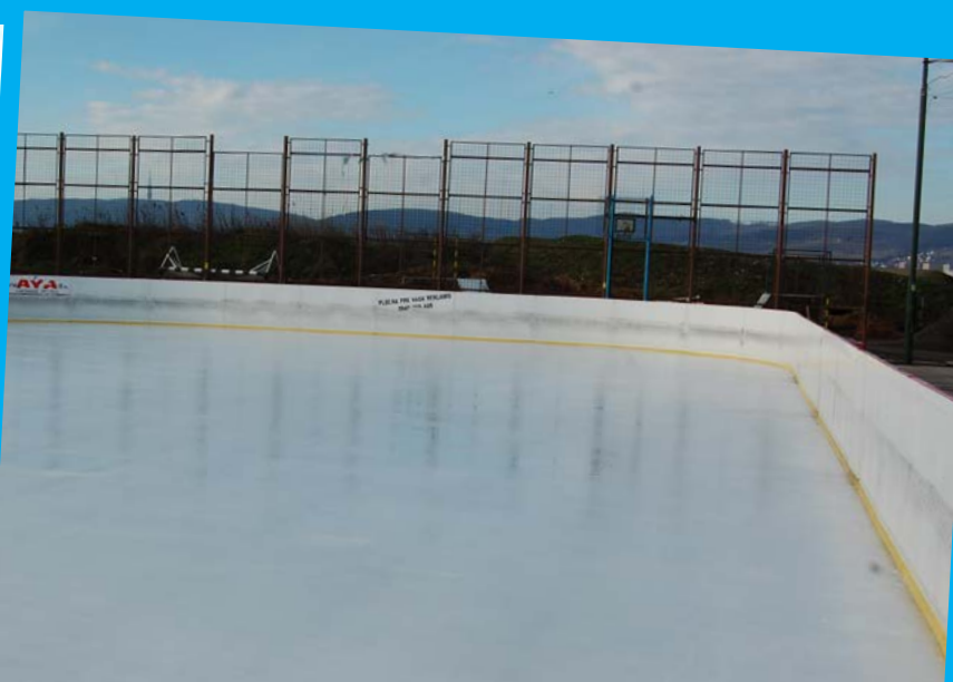
Už pravidelne pripravujeme pre obyvateľov Vajnory v zime ľadovú plochu. Len aby prišlo počasie.