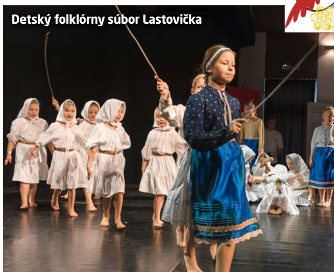
Detský folklórny súbor Lastovička