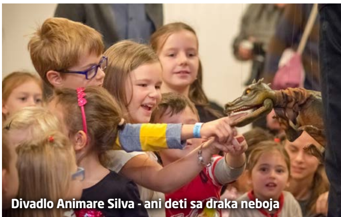
Divadlo Animare Silva - ani deti sa draka neboja