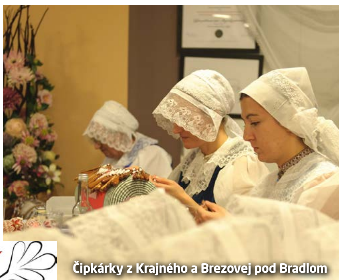
Čipkárky z Krajného a Brezovej pod Bradlom