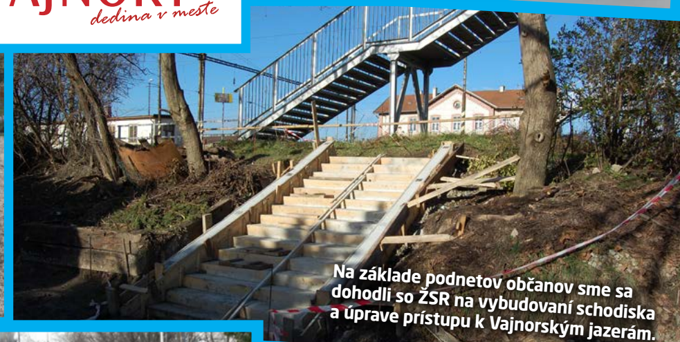
Na základe podnetov občanov sme sa dohodli so ŽSR na vybudovaní schodiska a úprave prístupu k Vajnorským jazerám.