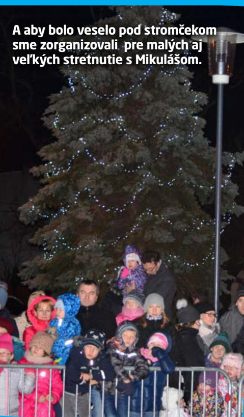
A aby bolo veselo pod stromčekom sme zorganizovali pre malých aj veľkých stretnutie s Mikulášom.