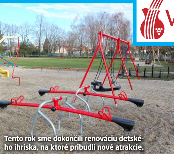
Tento rok sme dokončili renováciu detského ihriska, na ktoré pribudli nové atrakcie.