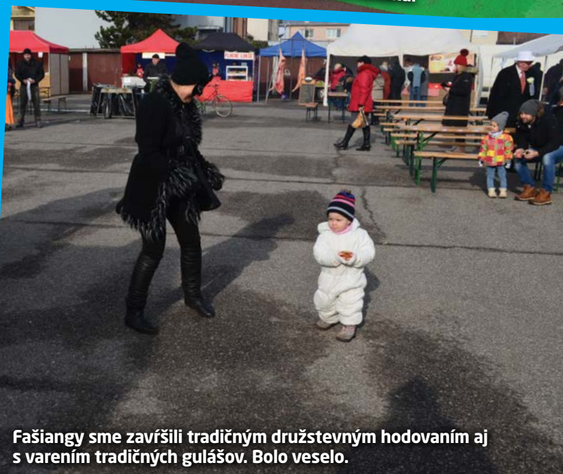
Fašiangy sme zavŕšili tradičným družstevným hodovaním aj s varením tradičných gulášov. Bolo veselo.