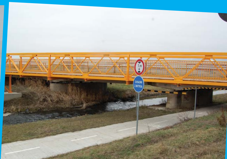
Dokončili sme cyklotrávku na trase Vajnory - Čierna Voda. Cyklot doprava je zase o čosi bezpečnejšia.