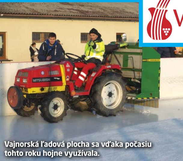
Vajnorská ľadová plocha sa vďaka počasiu tohto roku hojne využívala.