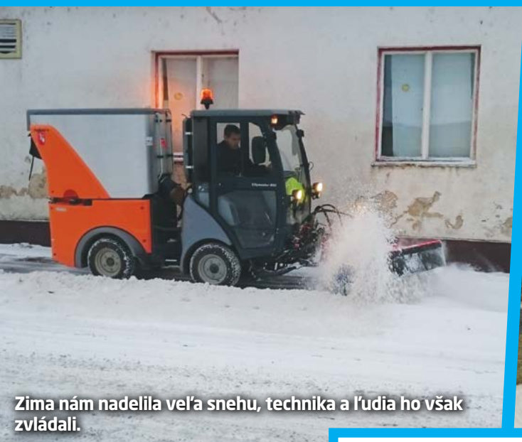
Zima nám nadelila veľa snehu, technika a ľudia ho však zvládali.