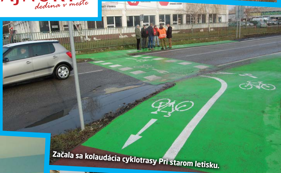
Začala sa kolaudácia cyklotrasy Pri starom letisku.