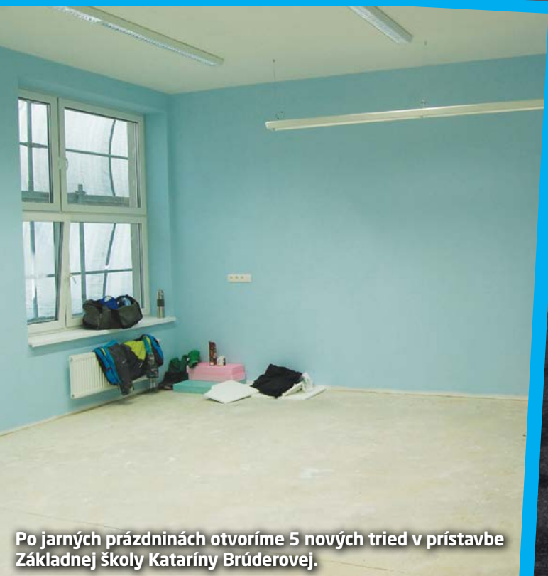
Po jarných prázdninách otvoríme 5 nových tried v prístavbe Základnej školy Kataríny Brúderovej.