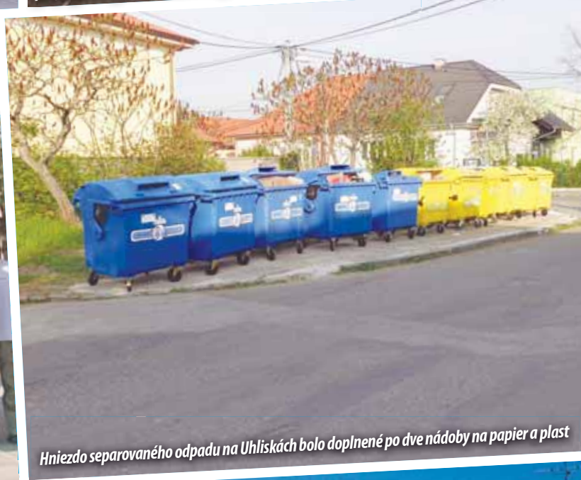
Hniezdo separovaného odpadu na Uhliskách bolo doplnené po dve nádoby na papier a plast