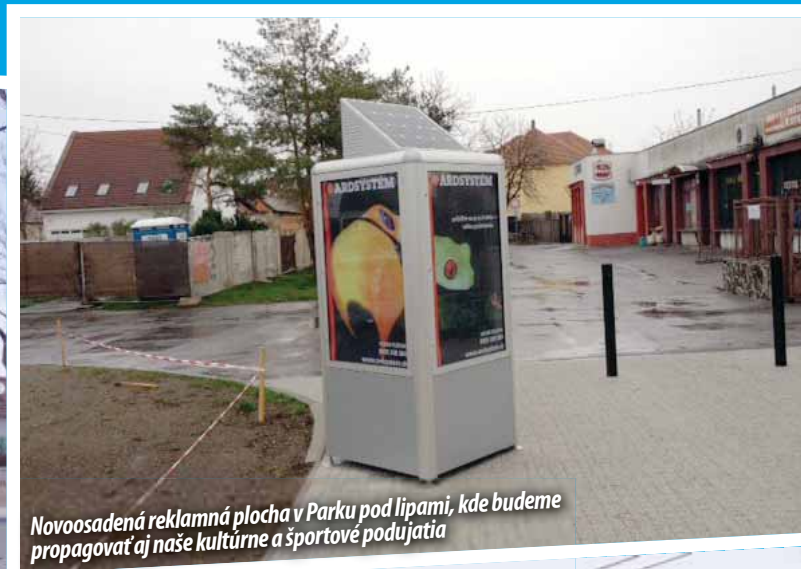
Novoosadená reklamná plocha v Parku pod lipami, kde budeme propagovať aj naše kultúrne a športové podujatia