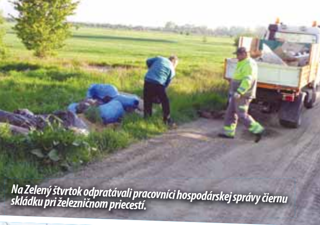
Na Zelený štvrtok odpratávali pracovníci hospodárskej správy čiernu skládku pri železničnom priecestí.