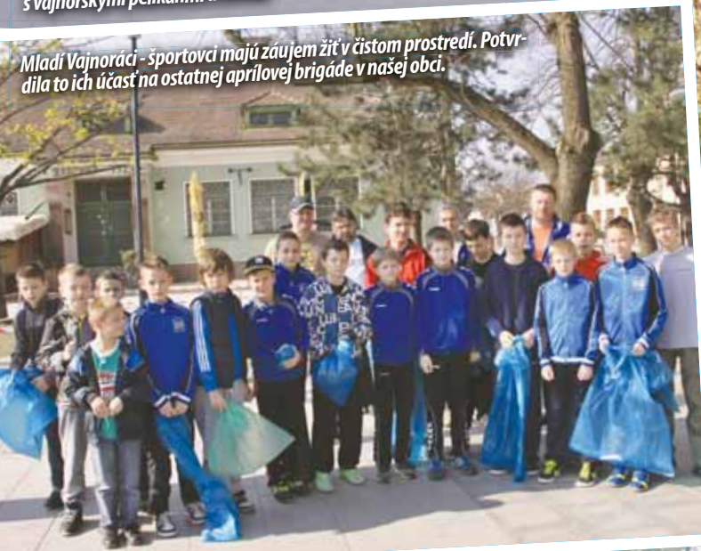
Mladí Vajnoračiaci - športovci majú záujem žiť v čistom prostredí. Potvrdila to ich účasť na ostatnej aprílovej brigáde v našej obci.