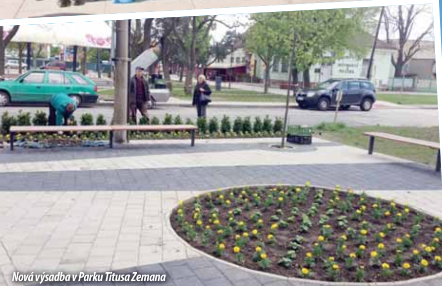
Nová výsadba v Parku Titusa Zemana