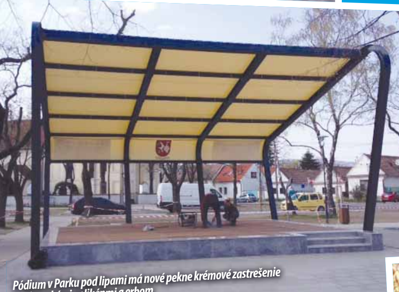
Pódium v Parku pod lipami má nové pekne krémové zastrešenie s vajnorškými pelikánmi a erbom