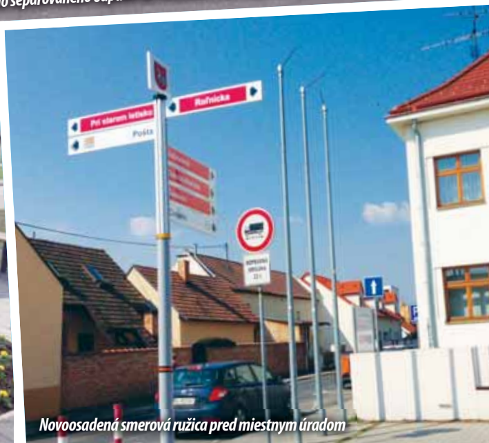
Novoosadená smerová ružica pred miestnym úradom