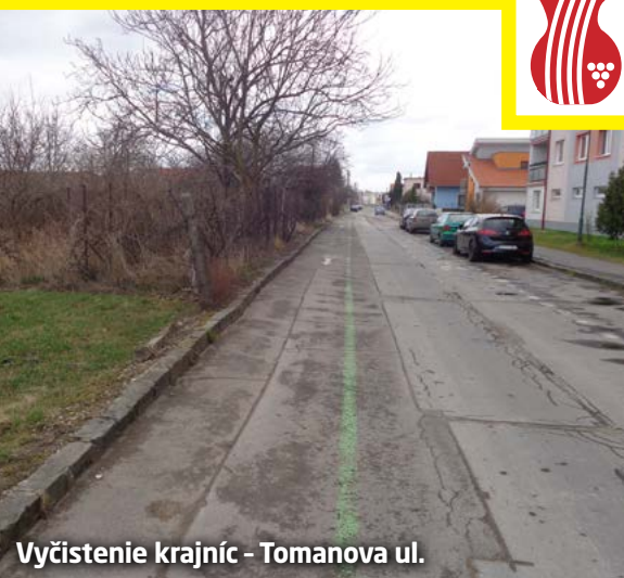
Vyčistenie krajníc - Tomanova ul.