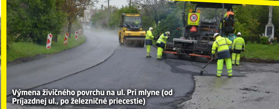
Výmena živичného povrchu na ul. Pri mlyne (od Príjazdnej ul., po železničné priecestie)