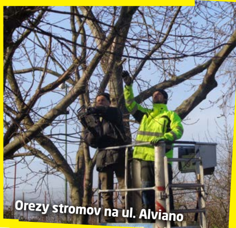
Orezy stromov na ul. Alviano