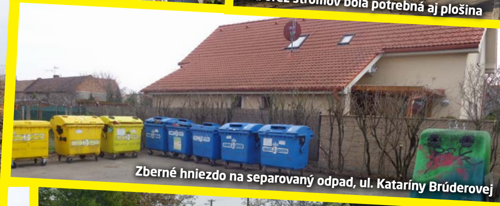
Zberné hniezdo na separovaný odpad, ul. Kataríny Brúderovej