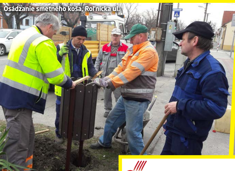
Osádzanie smetného koša, Rolnícka ul.