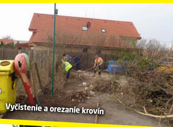
Vyčistenie a orezanie krovín