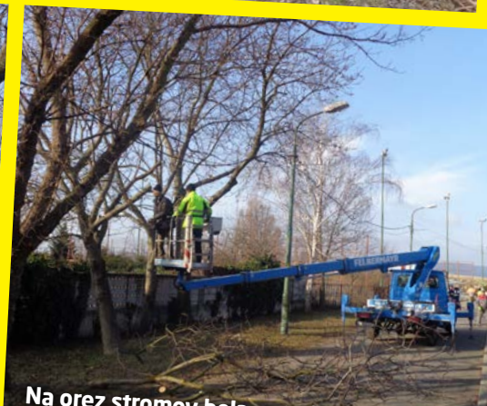
Na orez stromov bola potrebná aj plošina