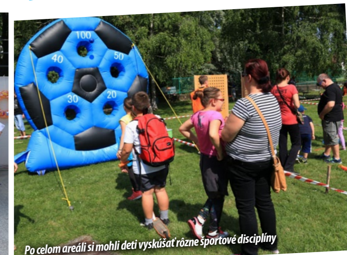
Po celom areáli si mohli deti vyskúšať rôzne športové disciplíny