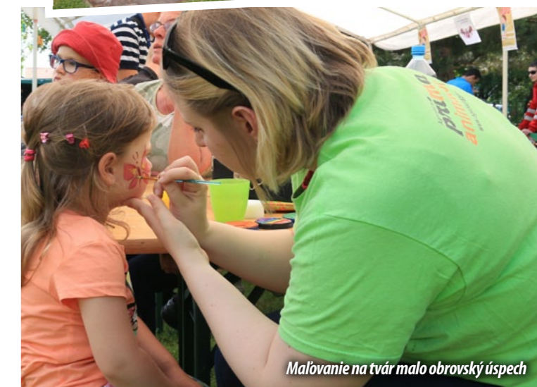
Maľovanie na tvár malo obrovský úspech

Coca-Cola HBC Slovenská republika, s.r.o.