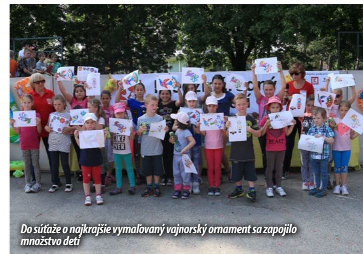
Do súťaže o najkrajšie vymalovaný vajnorový ornament sa zapojilo množstvo detí