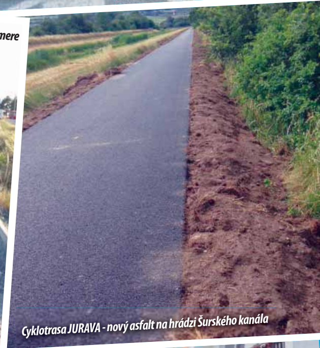
Cyklotrasa JURAVA - nový asfalt na hrádzi Šurského kanála