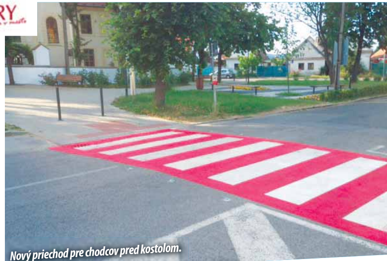
Nový priechod pre chodcov pred kostolom.