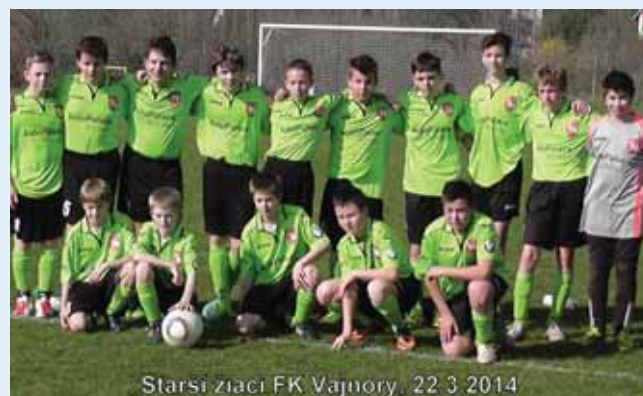
Starši ziaci FK Vajnory. 22.3.2014