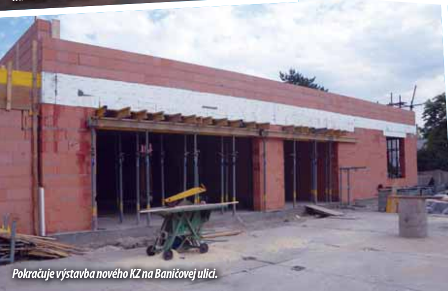
Pokračuje výstavba nového KZ na Baničovej ulici.