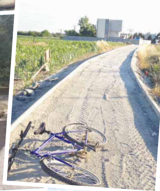
Cyklotrasa Jurava – nový cyklochodník za Vajnormi v smere na Čiernu vodu