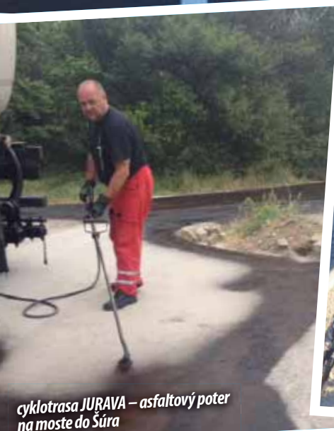
cyklotrasa JURAVA – asfaltový poter na moste do Šúra