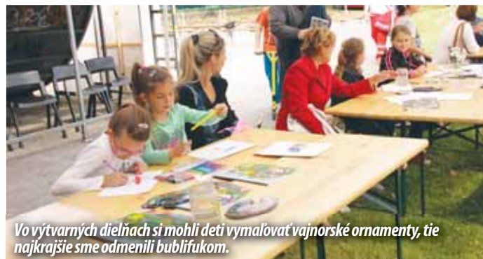
Vo výtvarných dielniach si mohli deti vymalovať vajnorské ornamente, tie najkrajšie sme odmenili bublifukom.