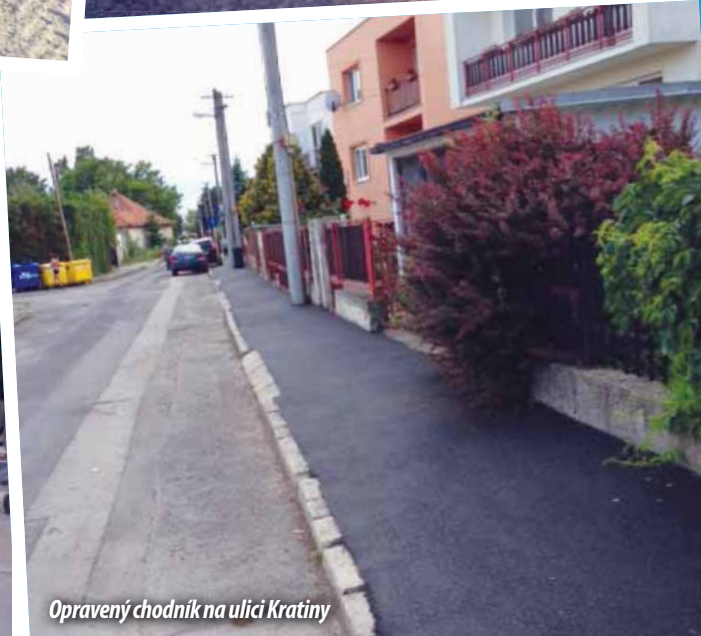
Opravený chodník na ulici Kratiny