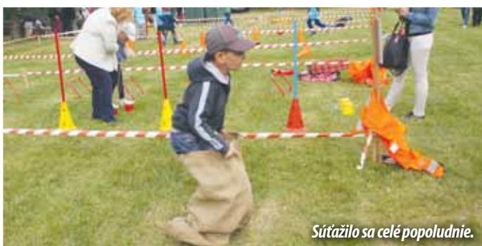
Súťažilo sa celé popoludnie.