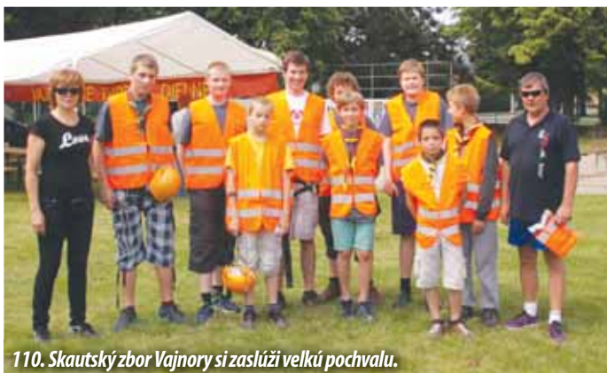
110. Skautský zbor Vajnory si zaslúži veľkú pochvalu.