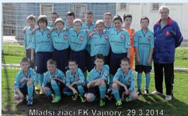
Mladsi ziaci FK Vajnory. 29.3.2014