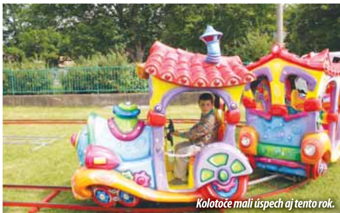
Kolotoče mali úspech aj tento rok.