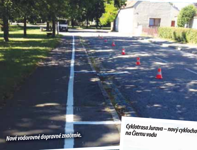
Nové vodorovné dopravné značenie.