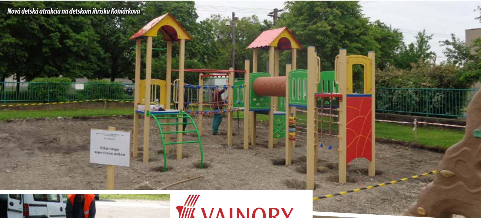
Nová detská atrakcia na detskom ihrisku Koniarkova