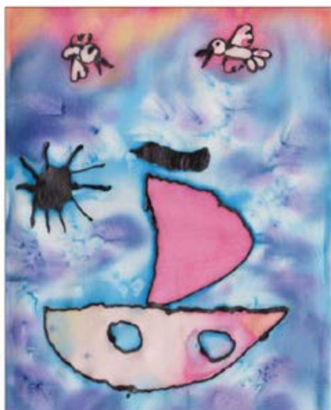
Isabel Raquel Espinoza: Plachetnica, maľba na bodváb, 2015