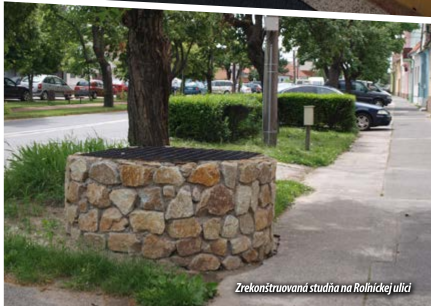
Zrekonštruovaná studňa na Rolníckej ulici