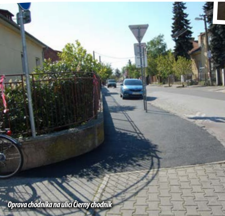
Oprava chodníka na ulici Černý chodník