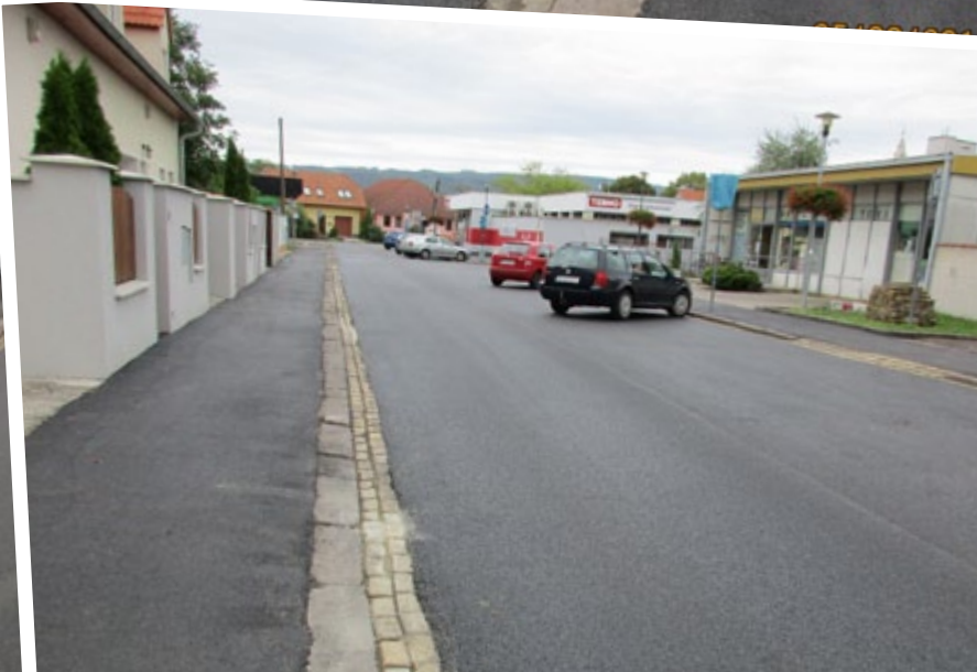
Nový chodník a cesta na Jačmennej ulici