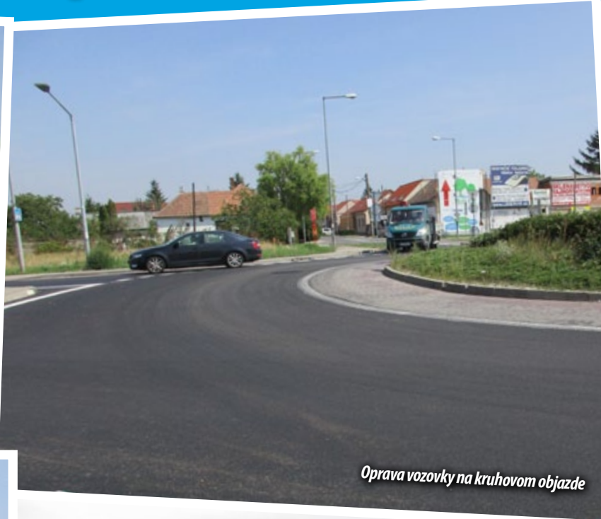
Oprava vozovky na kruhovom objazde