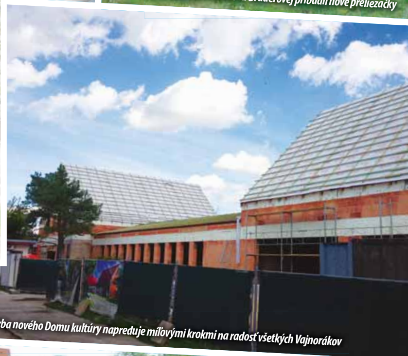
Stavba nového Domu kultúry napreduje milovými krokmi na radosť všetkých Vajnorákov