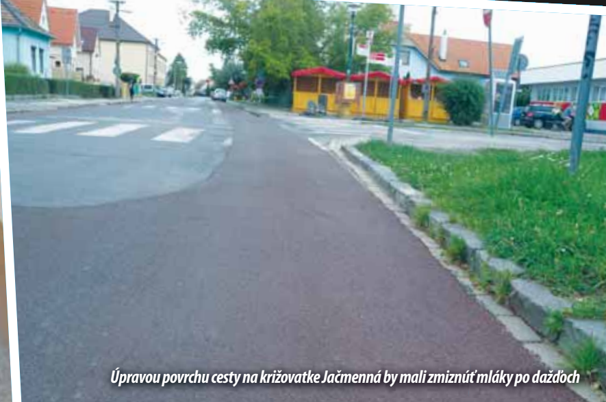
Úpravou povrchu cesty na križovatke Jačmenná by mali zmiznúť mláky po daždoch