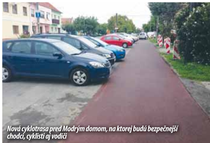
Nová cyklotrasa pred Modrým domom, na ktorej budú bezpečnejší chodci, cyklisti aj vodiči

Ministerstvo pôdohospodárstva a rozvoja vidieka SR schválilo Združeniu obcí JURAVA dotáciu na vybudovanie Malokarpatsko-šúrskej cyklomagistrály mestskými časťami Rača, Vajnory a mestom Svätý Jur. Ministerstvo, ako riadiaci orgán pre Operačný program Bratislavský kraj, vydalo súhlasné stanovisko k žiadosti združenia o nenávratný finančný príspevok vo výške 617.493 eur. Celkové oprávnené výdavky projektu boli schválené vo výške 649.993,34 eura. Stavebné povolenia sú vydané a platné. Zároveň je vo verejnom obstarávaní vysúťažovaný aj realizátor stavby. Okrem obsiahlej projektovej dokumentácie predložila JURAVA aj výsledky verejného obstarávania na dodávateľa prác, kde sa jej podarilo znížiť pôvodnú rozpočtovú cenu