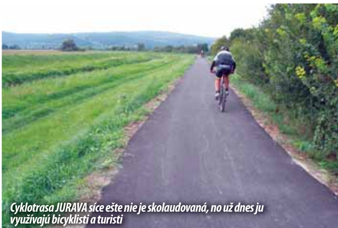
Cyklotrasa JURAVA síce ešte nie je skolaudovaná, no už dnes ju využívajú bicyklisti a turisti