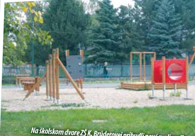
Na školskom dvore ZŠ K. Brúderovej pribudli nové preliezačky