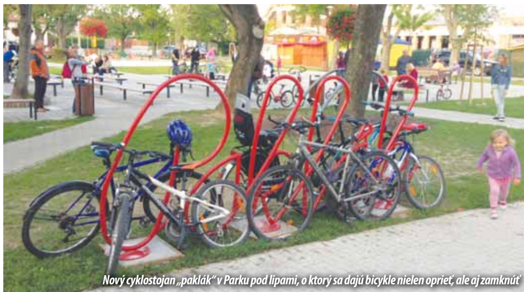
Nový cyklostojan „paklák“ v Parku pod lipami, o ktorý sa dajú bicykle nielen oprieť, ale aj zamknúť

Vajnory sú bicyklová dedina. Na bicykli jazdíme do obchodu, k lekárovi, do kostola, na ihrisko. Park pod lipami je často plný ľudí, a tak aj odstavených bicyklov, opretých o stromy, lavičky, kdekoľvek na tráve. Potrebujú stále a bezpečné miesto na od-