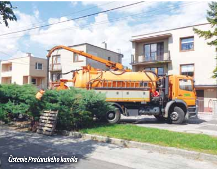
Čistenie Pračanského kanála