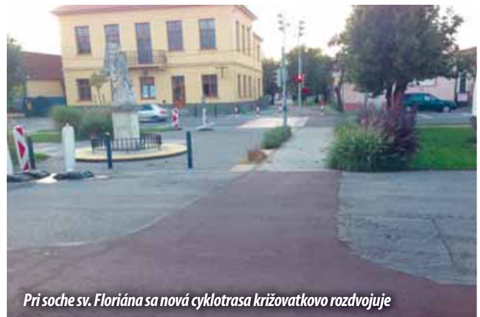
Pri soche sv. Floriána sa nová cyklotrasa križovatkovo rozdeľuje