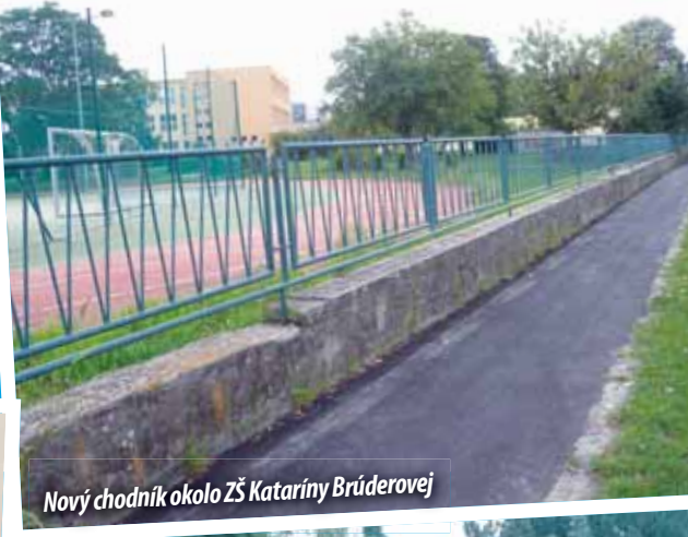
Nový chodník okolo ZŠ Kataríny Brúderovej