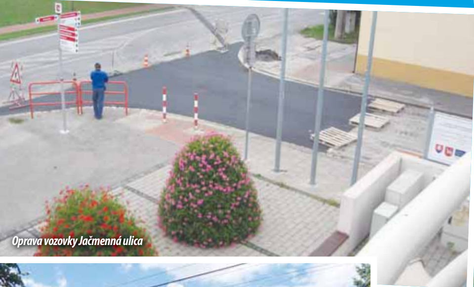
Oprava vozovky Jačmenná ulica