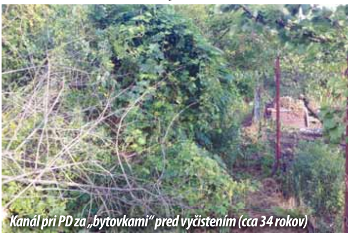
Kanál pri PD za „bytovkami“ pred vyčistením (cca 34 rokov)