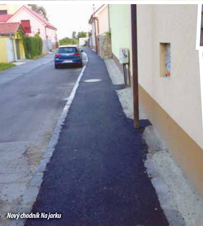
Nový chodník Na jarku