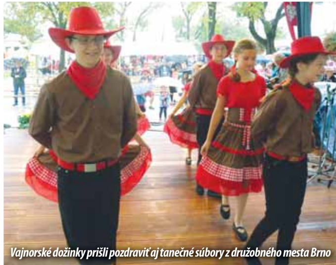
Vajnorské dožinky prišli pozdraviť aj tanečné súbory z družobného mesta Brno

Podľa jeho slov je Alviano zaujímavá obec s približne 1500 obyvateľmi, asi 90 km od Ríma na Tibere. „Taliani si nás vlastne našli, hľadali dáku obec v blízkosti Bratislavy s vinohradníckymi koreňmi, lebo aj u nich sa pestuje vinič. Táto družba je úžasná vec. Zopárkrát bola podporená aj fondmi z Bruselu. Pravidelne si vymieňame návštevy – autobus Vajnorákov každoročne chodí do Alviana na týždňový pobyt a Taliani vzápätí prídu k nám. My chodíme do Talianska okolo 15. augusta.