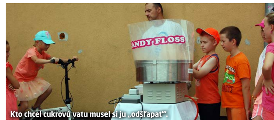
Kto chcel cukrovú vatu musel si ju „odšľapať“.