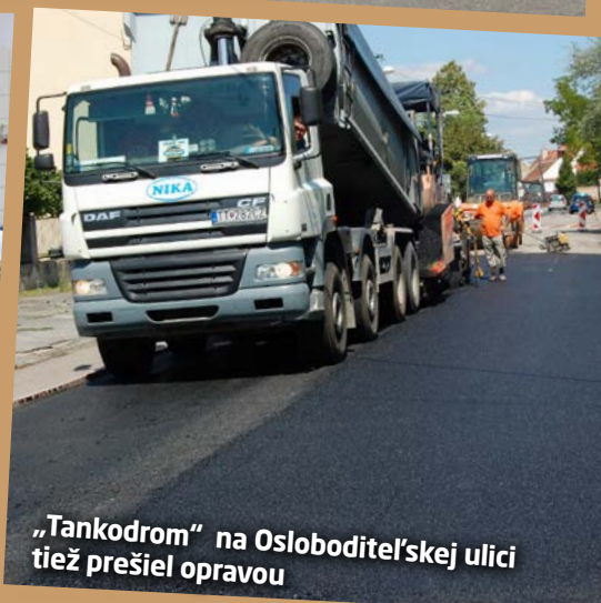
„Tankodrom“ na Osloboditeľskej ulici tiež prešiel opravou