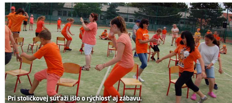
Pri stoličkovej súťaži išlo o rýchlosť aj zábavu.