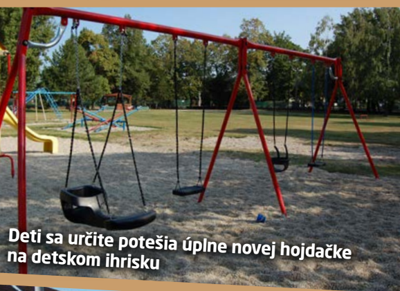
Deti sa určite potešia úplne novej hojdačke na detskom ihrisku