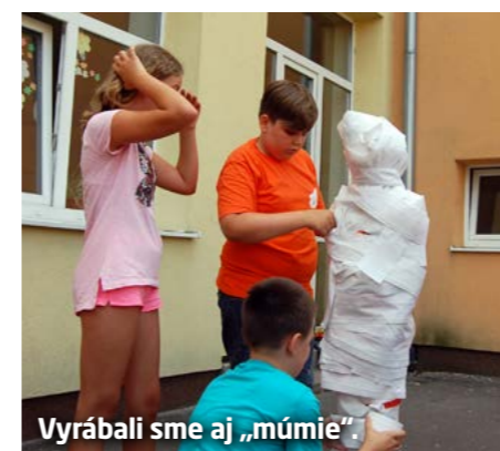
Vyrábali sme aj „múmie“.