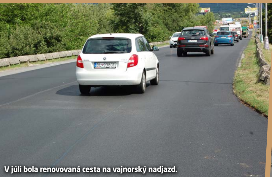
V júli bola renovovaná cesta na vajnorský nadjazd.