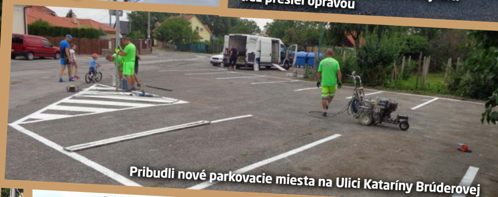
Pribudli nové parkovacie miesta na Ulici Kataríny Brúderovej