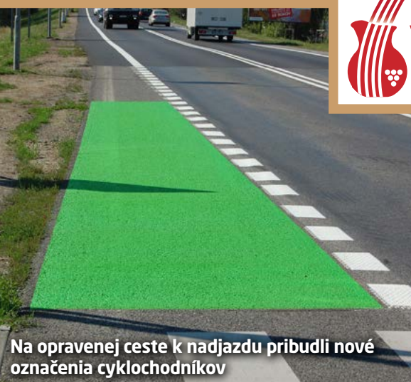
Na opravenej ceste k nadjazdu pribudli nové označenia cyklochodníkov