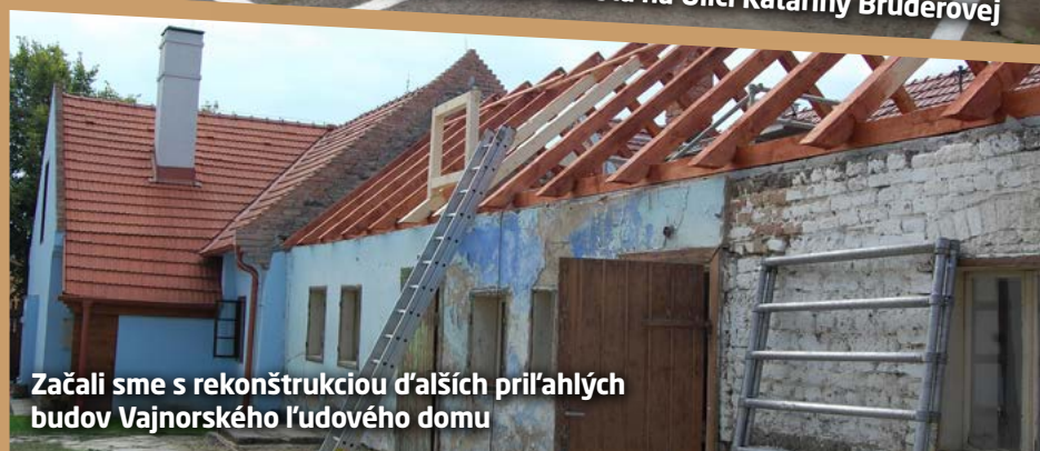
Začali sme s rekonštrukciou ďalších príľahlých budov Vajnorského ľudového domu