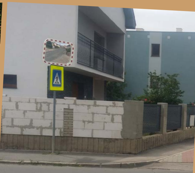
Bezpečnostné zrkadlo zlepši výhľad motoristom aj na križovatke ulíc Tomanova a Pri mlyne