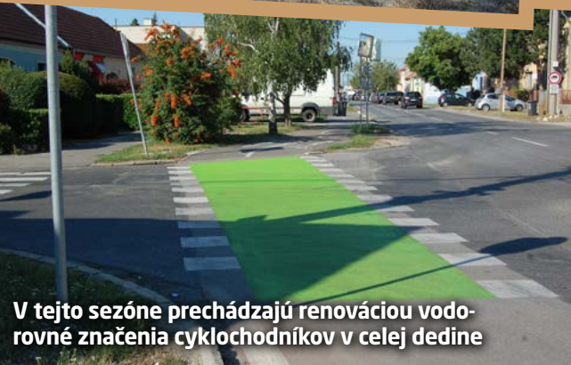
V tejto sezóne prechádzajú renováciou vodorovné značenia cyklochodníkov v celej dedine