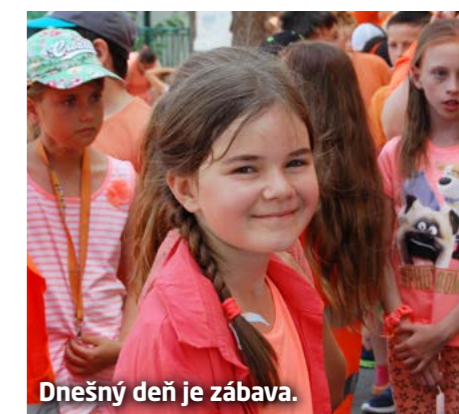
Dnešný deň je zábava.