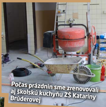
Počas prázdnin sme zrenovovali aj školskú kuchyňu ZŠ Kataríny Brúderovej