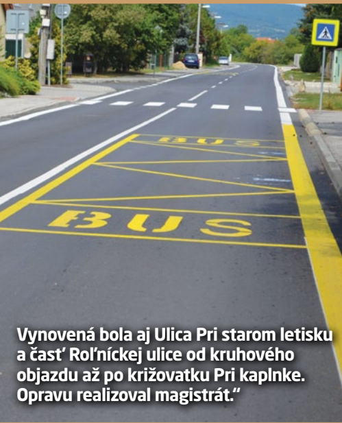
Vynovená bola aj Ulica Pri starom letisku a časť Roľníckej ulice od kruhového objazdu až po križovatku Pri kaplnke. Opravu realizoval magistrát.