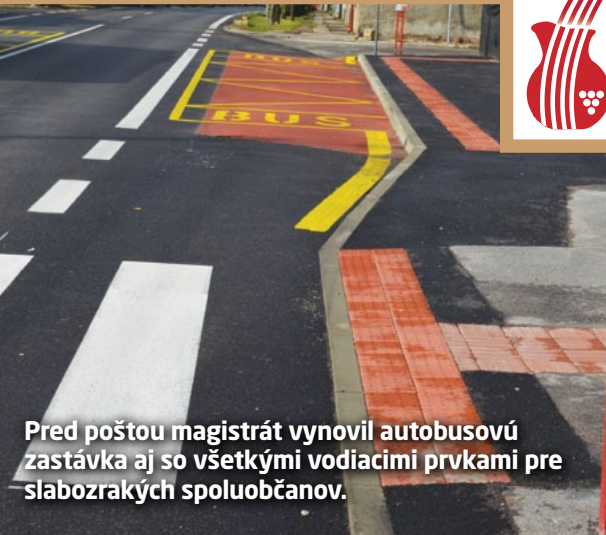
Pred poštou magistrát vynovil autobusovú zastávku aj so všetkými vodiacimi prvkami pre slabozrakých spoluobčanov.