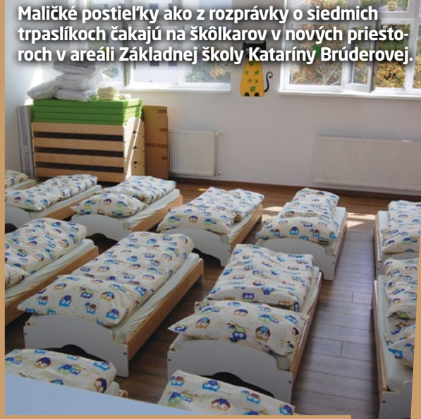
Maličké postielky ako z rozprávky o siedmich trpaslíkoch čakajú na škôlkarov v nových priestoroch v areáli Základnej školy Kataríny Brúderovej.