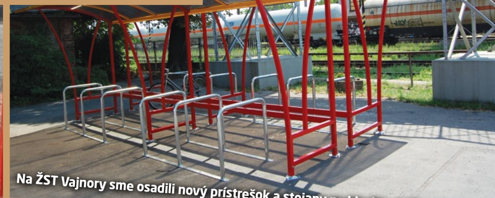
Na ŽST Vajnory sme osadili nový prístrešok a stojany na bicykle. Páči sa Vám to?