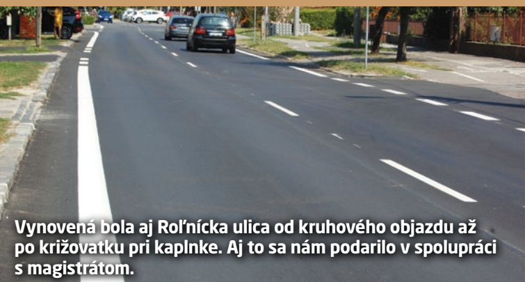
Vynovená bola aj Roľnícka ulica od kruhového objazdu až po križovatku pri kaplnke. Aj to sa nám podarilo v spolupráci s magistrátom.