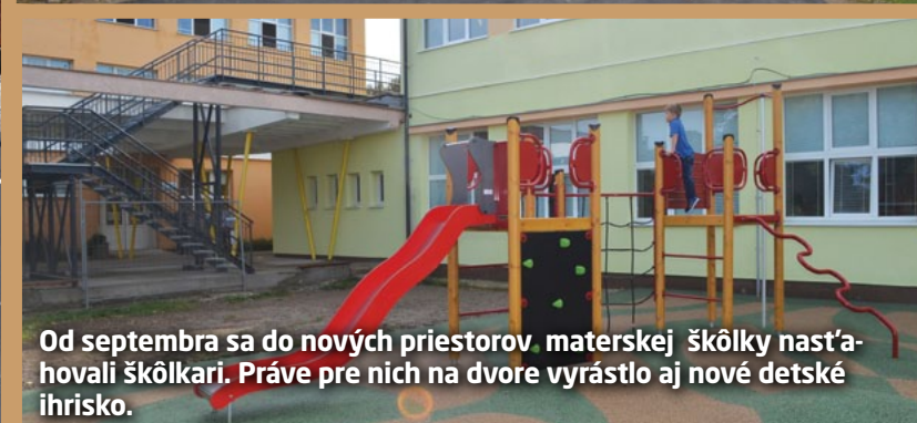
Od septembra sa do nových priestorov materskej škôlky nastáhovali škôlkari. Práve pre nich na dvore vyrástlo aj nové detské ihrisko.