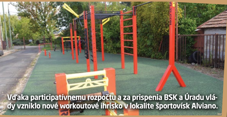
Vďaka participatívne rozpočtu a za príspevia BSK a Úradu vlády vzniklo nové workoutové ihrisko v lokalite športovísk Alviano.