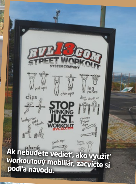
Ak nebudete vedieť, ako využiť workoutový mobiliár, zacvičte si podľa návodu.